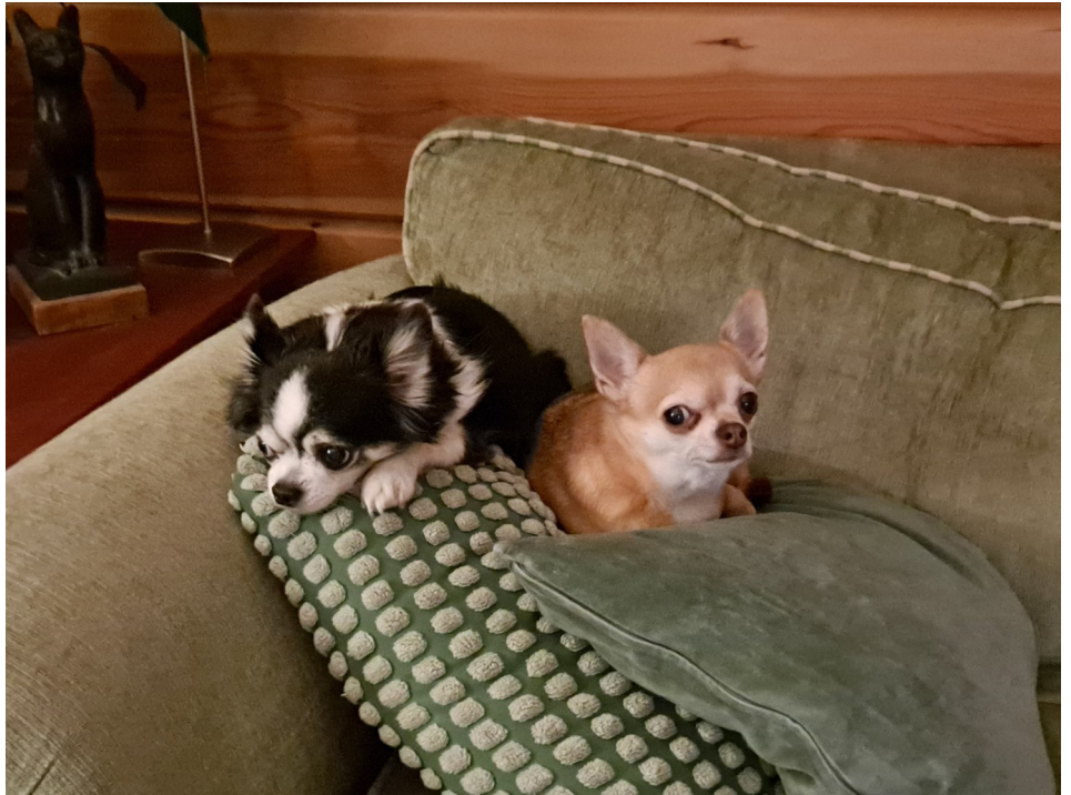
Nämä kaverit aloittivat rauhallisen joulun jo lokakuussa.

Liikehäiriösairauksien liitto vaipuu talviunille 21.12.2024 ja avautuu jälleen 7.1.2025. Kotisivuiltamme löytyvät jo vuoden 2025 kurssit, joten kannattaa vilkaista ennen joulutaukoa. https://www.liikehairio.fi/palvelut/parkinsonin-tauti/kurssit Ensi vuosi tuo mukanaan muutoksia Liikehäiriösairauksien liiton palvelutarjontaan rahoittajamme STEA:n säästöjen vuoksi. Kotisivuiltamme tarkennamme palvelujamme heti vuoden alkumetreillä. Olemme tavoitettavissa puhelimitse ja sähköpostilla jatkossakin, mutta vastausviive voi olla pidempi. Toivomme kaikilta ymmärrystä, jos emme heti voi vastata kyselyihinne. Näin loppuvuodesta on energia ja luovuus jo hieman alavireessä, joten annoin tekoälylle tehtävän: ”Tee runo, jossa aiheena on rauha, hyvántahtoisuus, toisten kunnioittaminen, tukeminen, vapaaehtoisuus.” Ja tällainen siitä tuli... Rauha on sydämessä, kirkas ja lämmin,