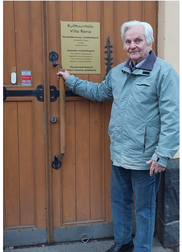
Kulttuuritalo Villa Ranaan pääsee myös esteettömästi — kuten kaikkiin muihinkin tilaisuuksiimme.

Mieleeni tuli , oliko portaat ainoa este tulla. Jäikö joku pois sen tähden, että ei ollut ketään, joka olisi ollut tukena joko henkisesti tai fyysisesti tai molempina näistä. Kerho-toiminnan tarkoituksena on antaa vertaistukea ja madaltaa kynnystä osallistua elämään mahdollisimman täysipainoisesti. Moni on löytänyt kerhosta myös uuden luotettavan ystävän.