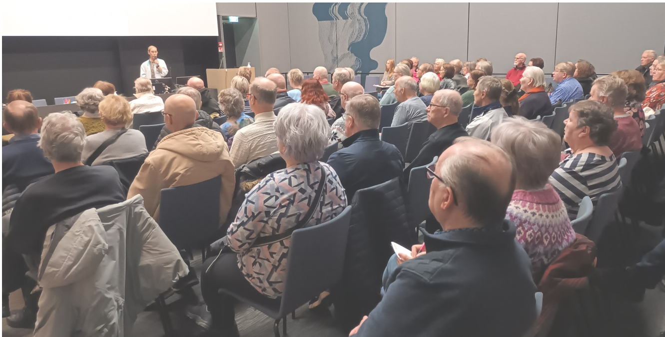
Sairaala Novan luentosali täyttyi tiedonjanoisista kuulijoista .

Ensitetopäivä järjestettiin Sairaala Novassa torstaina 5.12. Edellisestä oli ehtinyt kulua liki kaksi vuotta. Osallistujamäärä oli pieni yllätys, sillä Parkinson-tietoutta oli saapunut kuulemaan yli 70 henkilöä. Parkinson-diagnoosin saaneita oli yli puolet, mutta ilahduttavan runsaasti myös läheisiä oli paikalla.