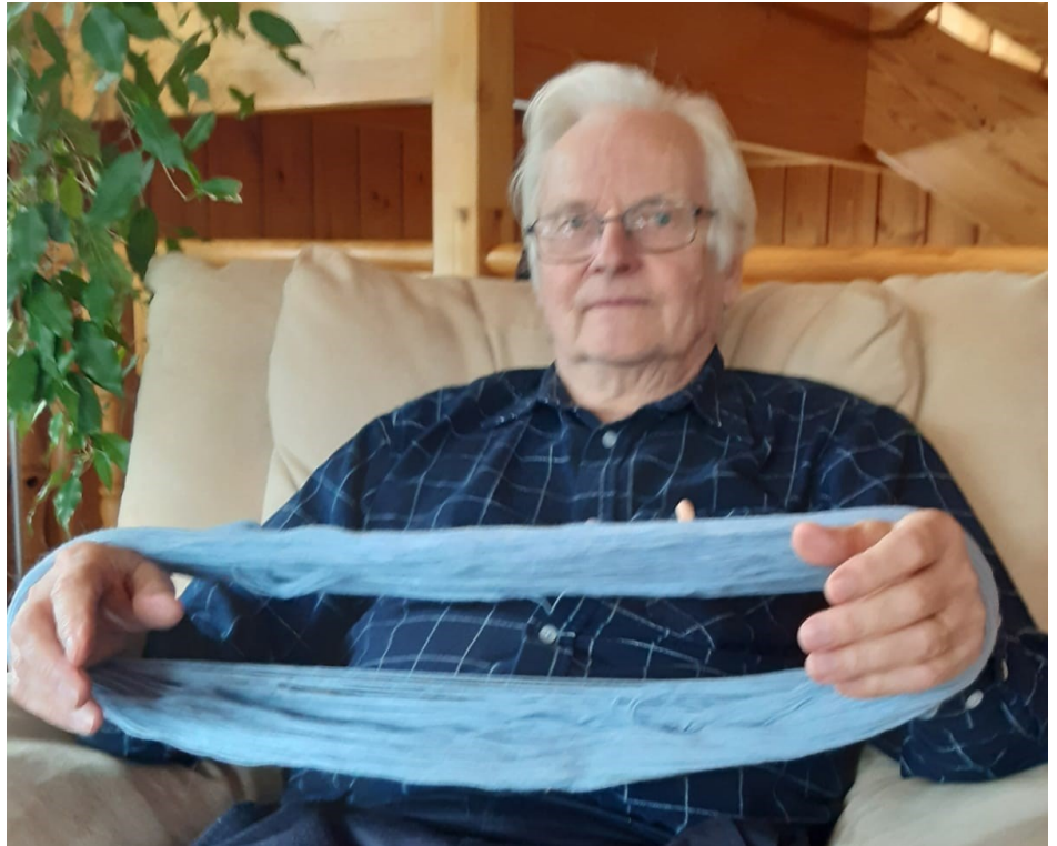
Ystävyyttä neulojalle voi osoittaa vaikka lankavyyhteä pitämällä.

toehtojaan. Pitäisikö hänen lopettaa kappassa käynti ja hoidattaa asiat jollakin toisella tavalla. Tai alkaa välttämään ihmisten tapaamisia. On melko varmaa, että sulkeuduttuaan vain kotiinsa hänen elämästään murentuu osa, joka ei enää palaudu. Ei näin luovuteta vielä, vaan mukaan toimintaan vaikkapa yhdistyksemme liikuntaharrasteisiin ja muihin tapaamisiin – ja mielusti läheisen kanssa.