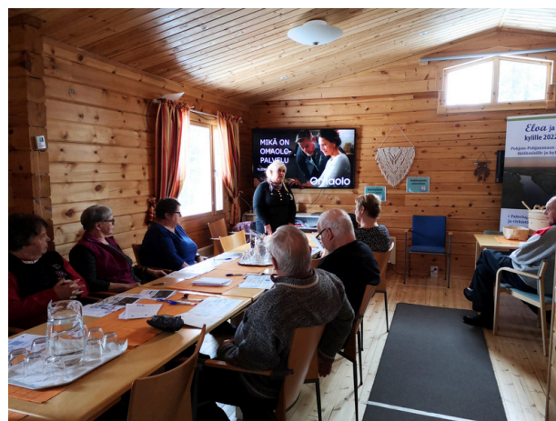
Pohteen tietoisuus Omaolo-digipalvelusta Kurkijärven hyvinvointipäivässä.

Jatkossa Eloa ja iloa kylille -toimintamallia voitaisiin viedä eteenpäin Pohjois-Pohjanmaan Kylät ry:n ja maakunnallisen kyläneuvosto-verkoston kautta, jotka tavoittavat hyvin kyliä. Hankkeessa saatuja kokemuksia ja toimintamallia voidaan puolestaan levittää alueen kuntiin PoPLin kuntakumppanuusmallin kautta. Kunnissa erityisesti liikuntatoimi on keskiössä toiminnan juurruttamisessa. Myös yhteistyö Pohteen kanssa on keskeistä.