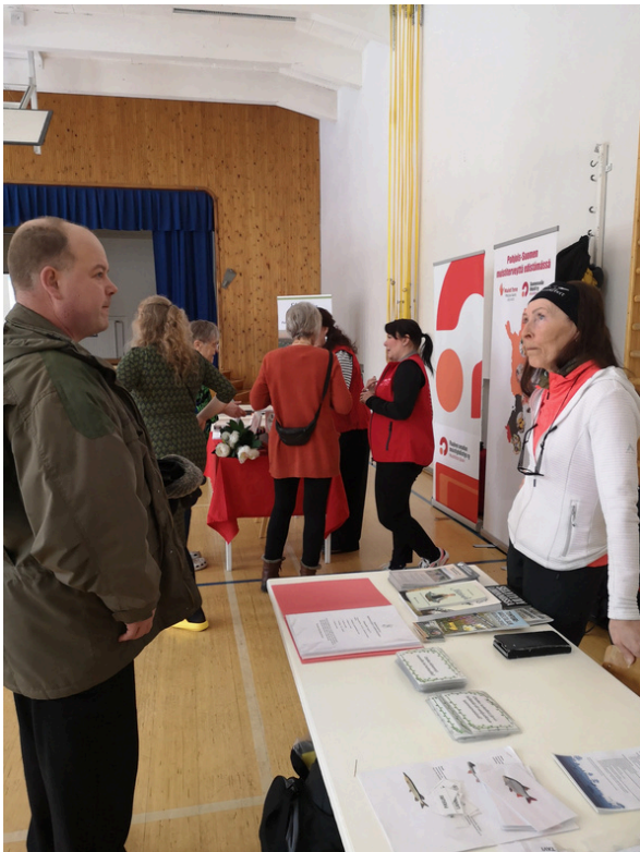
Yhdistykset ja yritykset tutuiksi -palvelupäivä Gunnarin Kartanossa Lampinsaaren kylällä.

Hankkeen toimintaa toteutettiin tiiviissä yhteistyössä kylien, kuntien, yhdistysten, paikallisten palveluntuottajien ja verkostojen kanssa. Palvelupäivien lähtökohtana oli yhteissuunnittelu ja -toteutus, joiden avulla pyrittiin vastaamaan mahdollisimman hyvin kylien ja kohderyhmien tarpeisiin. Yhteissuunnittelulla aktivoitiin kyliä toteuttamaan toimintaa verkostojen ja eri sidosryhmien kanssa, millä pyrittiin luomaan edellytyksiä toiminnan juurtumiselle. Sama toimintatapa oli myös useissa pop up -tapahtumissa.