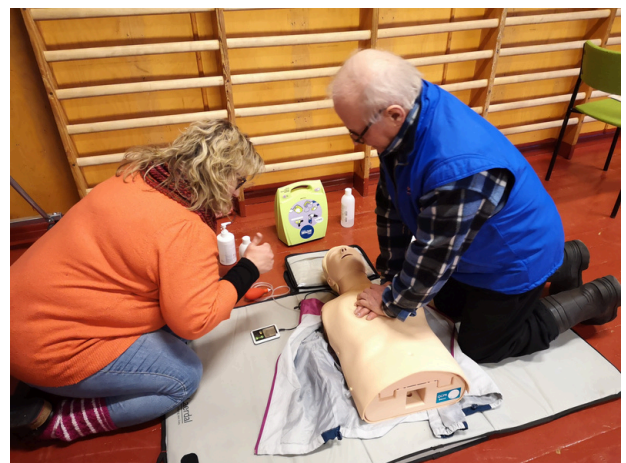
Ensiaputaitojen harjoittelua Kuusamossa Salmisen seudun hyvinvointipäivässä.

Koko kylän ulkoilu- ja toripäiviä toteutettiin esimerkiksi Muhoksen Mäntyrannalla ja Pudasjärvellä Rytingin kaupan pihapiirissä. Hanke osallistui myös Pyhännän Perttulinpäivien markkinoille omalla esittelypisteellä maakunnallisten kyläpäivien yhteydessä syyskuussa 2022.