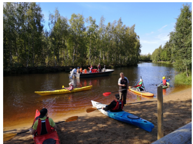
Vesiaktiiviteettien kokeilua Hiastinhaaran luontopäivässä Pohjois-Iissä.

Yhteistyökumppanit ja palveluntuottajat antoivat palautetta esimerkiksi hyvin sujuneesta tapahtumasta ja järjestelyistä. Erityisesti henkilökohtaisia hyvinvointipalveluja tarjonneet palveluntuottajat kokivat toiminnan kylällä olleen mielenkiintoinen ja kannattavakin kokeilu ja kertoivat olevansa valmiita tulemaan myös uudestaan, jos kylällä järjestetään vastaavanlaista toimintaa.