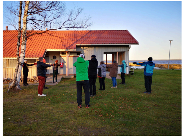
Kehonhuoltojumppaa Lumijoen Varjakassa.

Hankkeen edetessä pyrittiin hakemaan mukaan kyliä, jotka olivat kiinnostuneita kehittämään erityisesti arkipäivisin tapahtuvaa toimintaa ikäihmisille. Lisäksi tavoitteena oli suunnata toimintaa enemmän liikunnalliseen tekemiseen, terveyteen ja elintapoihin sekä urheiluseurojen kanssa tehtävään yhteistyöhön. Kyliä tavoiteltiin etenkin niiden kuntien alueelta, joista ei vielä ollut mukana yhteistyökylää. Kylätoimijoita oli kuitenkin aiempaa vaikeampi tavoittaa ja saada lähtemään mukaan hankkeeseen. Aktiivisilla kylillä oli käynnistynyt koronan jälkeen paljon toimintaa, mikä sitoi kylätoimijoiden resursseja. Hiljaisemmillä kylillä puolestaan olivat haasteina toimijoiden vähäinen määrä, yhteyshenkilöiden tavoittaminen ja tilojen puute.