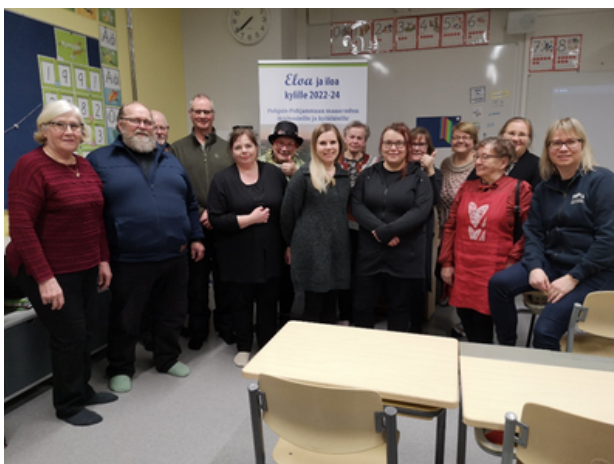
Eloa ja iloa kylille -hankkeen yhteistyökylien edustajia kylien tapaamisessa Laitasaaren kylällä.

Ensimmäinen tapaaminen järjestettiin Muhoksella Laitasaaren koululla helmikuussa 2023, ja tapaamiseen osallistui 21 kyläaktiivia seitsemältä yhteistyökylältä sekä Pudasjärven Korpisen kylältä. Kylät esittäytyivät, kertoivat toiminnastaan sekä menneistä ja tulevista palvelupäivistään. Vinkkejä jaettiin mm. rahoituksen hakemisesta sekä kylien toiminnan ja palvelujen kehittämisestä. Kylien välisiä vierailujakin ryhdyttiin suunnittelemaan. Tilaisuudessa kuultiin myös esimerkki Korpisen kylältä, missä virkistyspäiviä (palvelupäiviä) on toteutettu jo vuosikymmenen ajan.