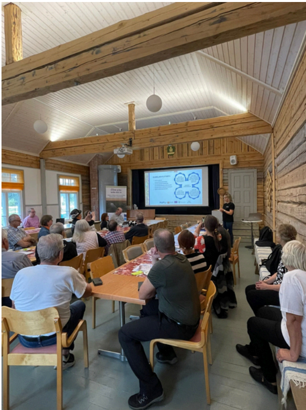
Hankkeen tulosten esittelyä päätösseminaarissa Temmeksellä.