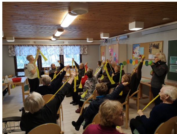
Kuminauhajumppaa Kunnan Mummolassa Temmeksellä.

Kunnan Mummola -kiertue toteutettiin 12 paikkakunnalla yhdessä PoPLin Yhdistyksistä hyvinvointia -hankkeen, Suomenselän Muisti ry:n, Ikäinstituutin sekä alueen kuntien kanssa 5.–18.5.2022. Kunnan Mummolat olivat yli 65-vuotiaille suunnattuja leppoisia ja toiminnallisia tapahtumia, joissa oli mahdollista testata tasapainoa, lihasvoimaa, toimintakykyä ja kehonkoostumusta, osallistua kuminauhajumppaan ja Ikäinstituutin etäjumppaan sekä saada tietoa liikkumisesta. Kunnan Mummola -testit sisälsivät yhdellä jalalla seisomisen, 5 x tuoilta ylösnousun, timed up and go -toimintakykytestin (kävelytestin) sekä käden puristusvoiman mittauksen. Kunnan Mummola on Lapin Liikunta ry:n kehittämä toimintamalli, jonka avulla pyritään ehkäisemään ikäihmisten kaatumisia. Kiertue toimi samalla Eloa ja iloa kylille -hankkeen markkinointi- ja rekrytointikiertueena kuntiin ja kyliin.