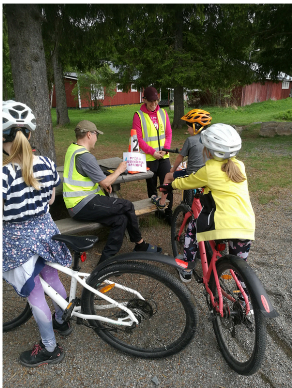
Pyöräsuunnistuspiste kiinnosti On pop liikkua pyörällä -tapahtumassa Pohjois-Iissä.

On pop liikkua pyörällä -tapahtumien toimintapisteillä oli mahdollista katsastaa oma pyörä ja kerrata liikennesääntöjä Liikenneturvan tietovisassa. Pyöräilytaitoja päästiin kokeilemaan ajotaitoradalla ja nopeutta kiihdytysuoralla. Pyöräsuunnistussprintissä opeteltiin leimaamista rastipisteillä ja kisailtiin, miten nopeasti radan saa suoritettua. Pyöräsuunnistuksesta tulikin kiertueen varsinainen hitti, ja rataa innostuttiin kiertämään myös juosten. Pyöräleikit, kuten saippuakuplien nappaus ja leikkivarjon alta pujottelu kiinnostivat etenkin pienempiä lapsia. Kiertueella oli kokeiltavana fatbike- ja BMX-pyöriä, jotka olivat liikkeellä lähes tauotta. Fatbiket kiinnostivat myös aikuisia kävijöitä. Kokeiltavana olleet kaksi BMX-pyörää arvottiin osallistuneiden kesken kiertueen päätteeksi.