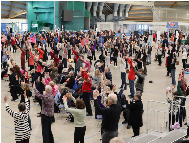
Ainot ja Reinot liikkeelle -tapahtumat liikuttivat senioreita Ouluhallissa.

Tapahtumat keräsivät vuosittain 2000–3150 kävijää, joista useat saapuivat lähikunnista. Linja-autokuljetuksia järjestettiin tapahtumaan esimerkiksi Limingasta, Siikajoelta, Siikalatvalta ja Tyrnävältä. Vuonna 2023 Iistä oli mukana Pohjois-Iin kyläläisiä ja vuonna 2024 Raahesta Lampinsaaren kyläläisiä, joille tapahtuma oli osa PoPLin Eloa ja iloa kylille -hankkeen järjestämää palvelu- ja virkistyspäivää.