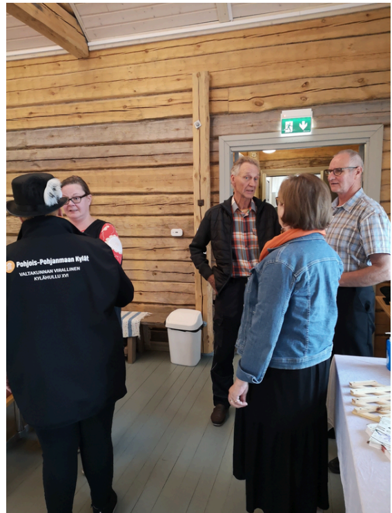
Kylätoimijoita yhteistyökylien kolmannessa tapaamisessa Temmeksellä.

Toinen tapaaminen oli Kyläpalveluista hyvinvointia -tilaisuuden yhteydessä Kiimingissä Hannuksen kylätalolla marraskuussa 2023. Osallistujia oli 14 henkilöä seitsemältä yhteistyökylältä. Kylät kertoivat jatkosuunnitelmistaan palvelupäivien kehittämiseksi, ja vastikään mukaan tulleet kylät kävivät läpi tulossa olevia palvelupäiviä. Kylät jakoivat jälleen myös vinkkejä ja esimerkkejä omalta kylältään.