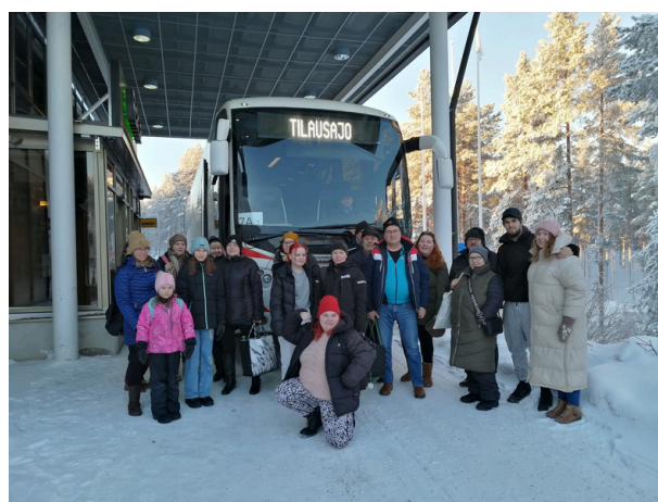
Lamujoki-Ojalankylän kyläläisiä virkistyspäivän vietossa Rokualla.

Muita virkistyspäivän kohteita olivat muun muassa Kymälän retkeilyalue, Maalaiskartano Pihkala, Linnakallio sekä Ainot ja Reinot liikkeelle – liikuntatapahtuma Ouluhallissa. Kolme kylää tutustui kulttuuripalveluihin ja vieraili virkistys- päivänä muun muassa kesäteatterissa. Siuruan kylälle järjestettiin poikkeuksellisesti kaksi virkistyspäivää, joista toinen suuntautui Pudas- järven Kurenalle ikäihmisille kohdennettuun, usean toimijan yhteistyönä järjestettyihin Ystävän- päiväpörskeisiin helmikuussa 2023. Myös Vepsän kyläläiset vierailivat samassa tapahtumassa. Pohjois-Iin kylän talvinen virkistyspäivä puolestaan toteutettiin omalla kylällä Pauhussa.