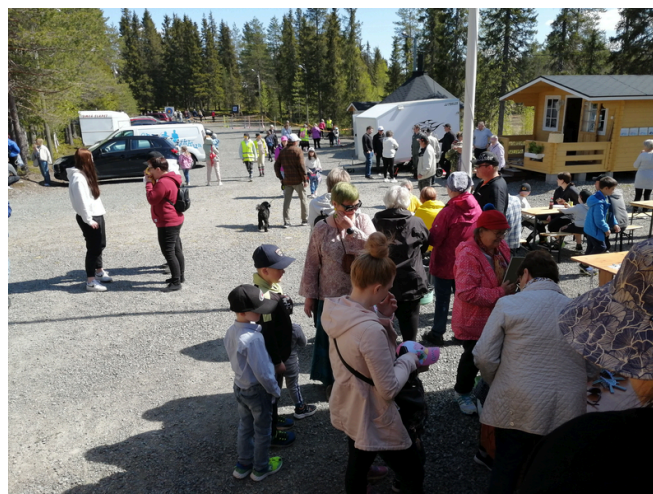
Avoimet Kylät -päivä sai väkeä liikkeelle Kurkijärvellä.

Kylätoimijoiden palautetta palvelu- ja virkistyspäivistä