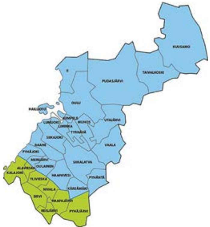
PoPLin toiminta-alue, päätoimialue sinisellä.

”Terve sielu terveessä ruumiissa,” lausui roomalainen runoilija Juvenalis jo ennen ajanlaskun alkua.