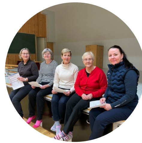
Hyvinvointia kylille -hankkeella oli vilkas syksy