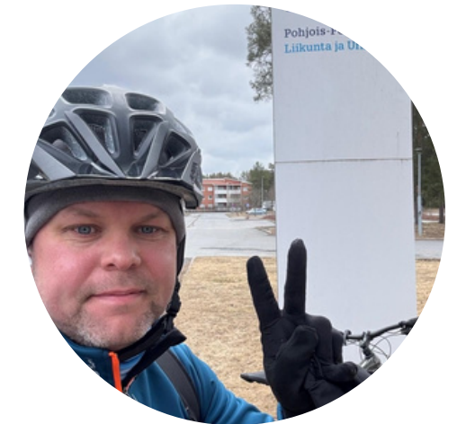
Pyörällä töihin -päivään aluejohtajan johdolla toukokuussa