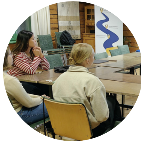
Nuoret yhdistystaitajat -koulutuskokonaisuus käynnisti helmikuussa