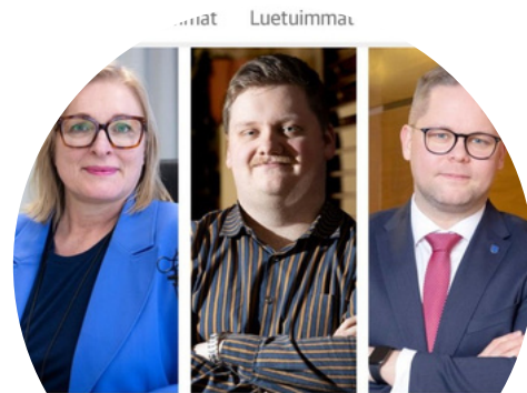
PoPLi lobbauksen kolmen kärjessä heinäkuu