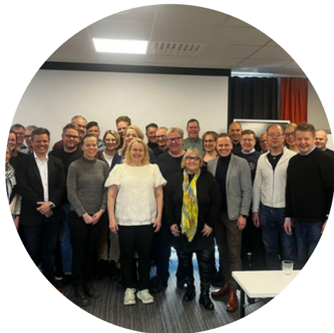
Aluejohdon neuvottelupäivät Seinäjoella maaliskuussa