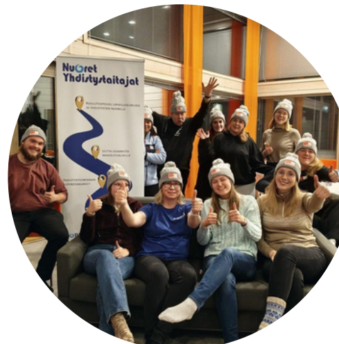
Nuoret yhdistystaitajat -hanke Ruka Nordicissa marraskuussa