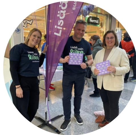
Lisää vain liike -tapahtuma Valkeassa lokakuussa