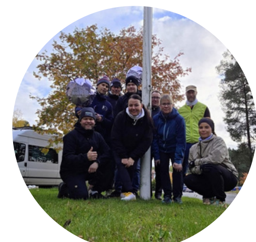
Syksyn liikuntakisailu jäkiekkoliiton kanssa ja niukka häviö!