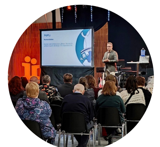
Pohjois-Pohjanmaan hyvinvointifoorumi marraskuu