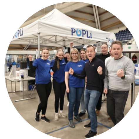
Ainot ja Reinot huhtikuussa