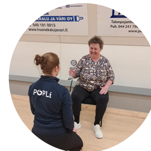
Muutosvoima-hanke käynnistyi marraskuussa