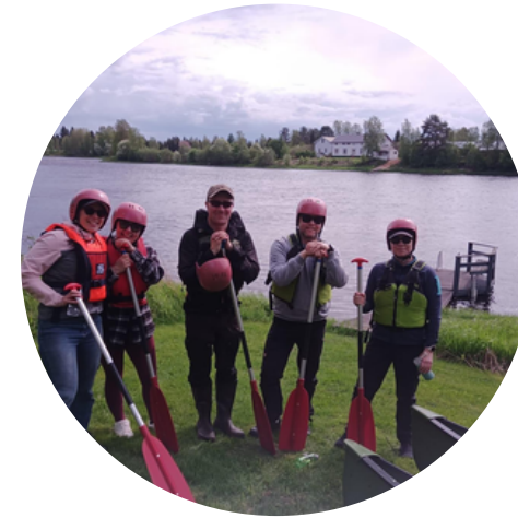
Keväällä virkistettiin meloessa