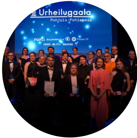
Pohjois-Pohjanmaan Urheilugaala helmikuussa