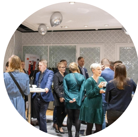
PoPLi 30 vuotta marraskuu