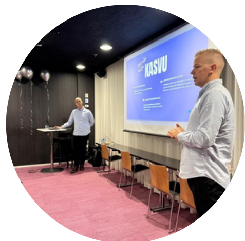
PoPLin juhlaseminaari marraskuu