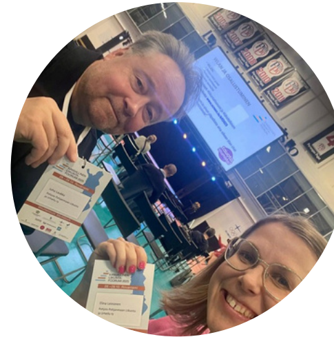
Kansallinen liikuntafoorumi Rovaniemellä lokakuussa