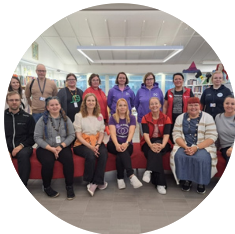
Muista hyvinvointisi -kiertue Pohjois-Pohjanmaalla toukokuussa