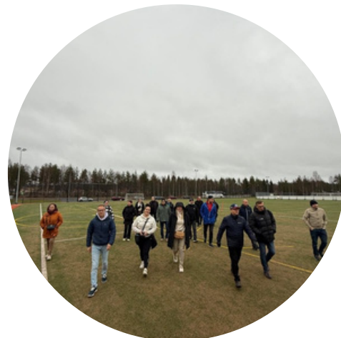
Kuntakumppanit Rovaniemellä lokakuussa