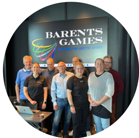
Barents Urheilun kehittämispäivät syyskuussa