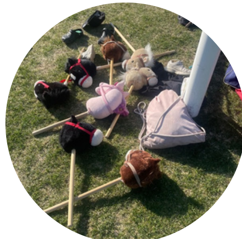
Pohjan OP perheliikuntatapahtuma -kiertue touko- kesäkuussa