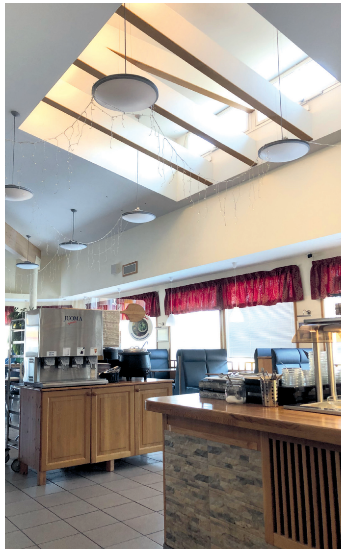
Huoltoaseman ravintolatilaja uudistettaessa tilan tun- tua lisättiin korkealla sisäkattoratkaisulla.

Liikenneaseman ravintola on huolehtinut yleis- ten juhlapäivien tarjonnan (pääsiäinen, vappu, äitienpäivä, juhannus, isänpäivä, itsenäisyyspäi- vä) lisäksi yksityistilaisuuksien, vuosijuhlien, yh- distysten ja harrastusryhmien tapahtumien laa- dukkaasta esillepanosta.