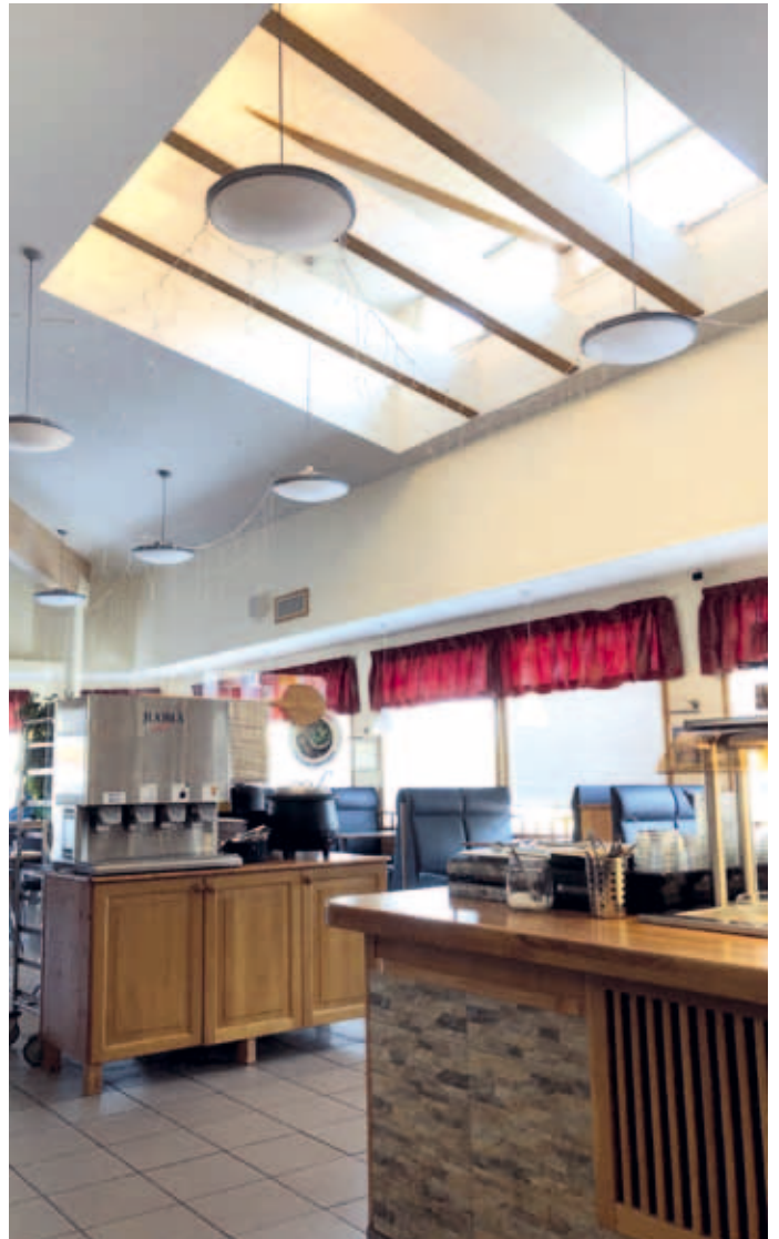
Huoltoaseman ravintolatiloja uudistettaessa tilan tuntua lisättiin korkealla sisäkattoratkaisulla.