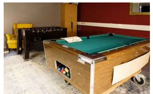
Biljardipöytä on yleensä suosittu