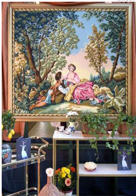
Asukkaat lainasivat tapahtumaan valmistamia taideteoksia, kuten mosaiikkia ja valttavan ristipistotyön