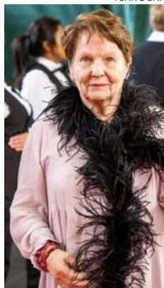
Eva asteli balettikatsomoon punaista mattoa pitkin