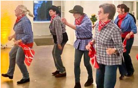
Rekolan Marttojen oma rivitanssiryhmä vauhdissa