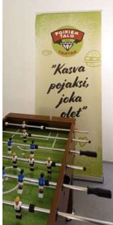
Poikien Talossa saat olla kuka olet

”Sitten on kunniaväkivaltaan liittyviä hankkeita. Itä-Pasilassa on sosiaalista nuorisotyötä. Loiste on tämmöinen keskisuuri sote-järjestö. Mei-