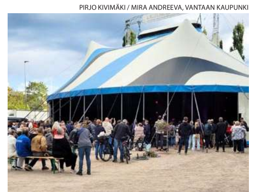
Puistokonsertti Rautkallion kentällä

Lisätiedot roskatalloista ja niiden ajankohdista löytyvät Vantaan tapahtumakalenterista.