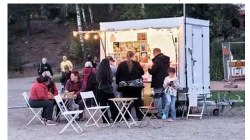
Puistokonsertin kahvio Rautkallion kentällä