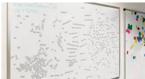
Jäkäappimagneetit saavat runosuonen sykkimään