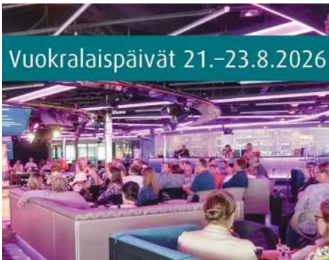
Vuokralaiset ry:n Vuokralaispäivät pidetään tänä vuonna Viking Linen m/s Gabriellalla

Nautittuaan synttärilahvit, teemalla: Vuokralaiset 80 vuotta, hänet päästettiin "Ekana" luomaan katsaus sekä kaupungin että hyvinvointialueen tilanteeseen ja ainakin nämä asiat tulivat esille: Vantaan kaupungin vuoden 2025 tilinpäätös näyttää noin 80 miljoonaa euroa miinusta. Suurimmat syyt alijäämiseen tulokseen ovat korkea työttömyys, siitä johdettavat sakkomaksut, vähentyneet investoinnit, rakentamisen hyytyminen ja verotulojen aleneminen, vaikka kaupunkiin tuli uusia asukkaita 2500 viime vuonna.