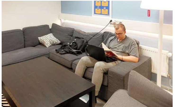
Teinikellarissa voi olla myös omissa oloissaan