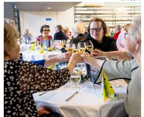
Väliajalla nautittiin Ravintola Flyygelin tarjoiluista