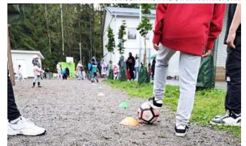
Lasten ja nuorten hyvinvointiviikolla oppilaat osallistuivat retkiin, työpajoihin ja vierailuihin