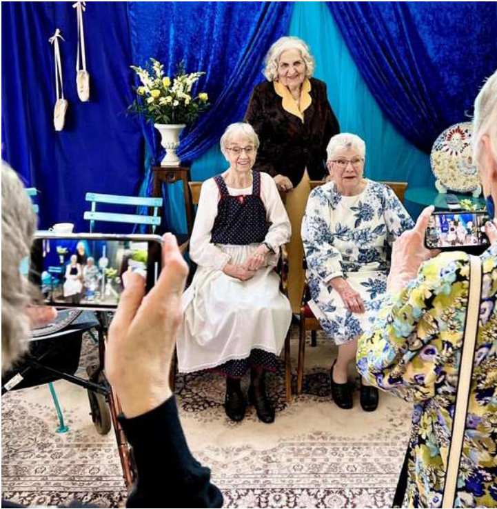
Somistusryhmän luomassa kuvauspisteessä otettiin valokuvia muistoksi Kotioopperasta