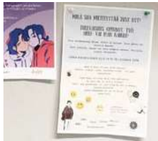
Muut järjestöt jättävät ilmoituksiaan

dän rahoituksemme tulee STEA:lta eli entiseltä Raha-automaattiyhdistykseltä”, Lehtovirta valottaa.