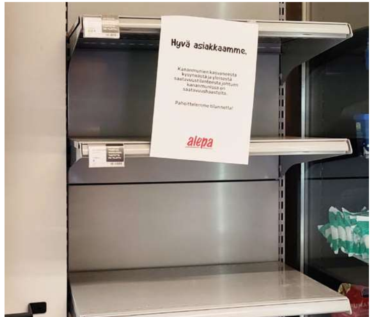
Alepa Havukosken hyllyt ammottivat tyhjänä keväällä.

“K-Citymarket Koivukylässä kananmunien saatavuus on ollut pääosin hyvällä tasolla. Mahdolliset saatavuuskat-