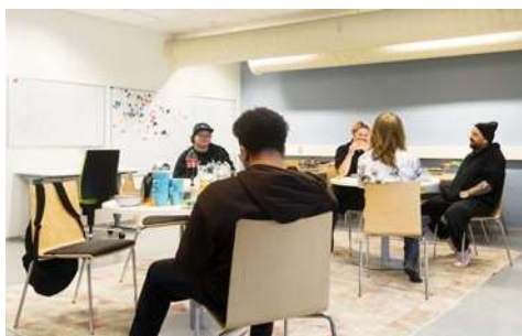
Keskiviikkona vietettiin synttäreitä