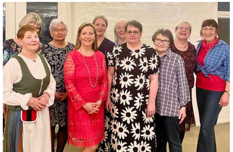
Rekolan Marttojen hallituksen jäsenet yhteiskuvassa

kiitoksena aktiivisesta vapaaehtoistoiminnasta marttajärjestössä. Hänelle luovutettiin kunniakirja sekä "Naisen ääni" -koru ja kukat. Hän on Rekolan Marttojen 4. kunniajäsen. Aikaisemmin kunniajäseneksi kutsuttuja