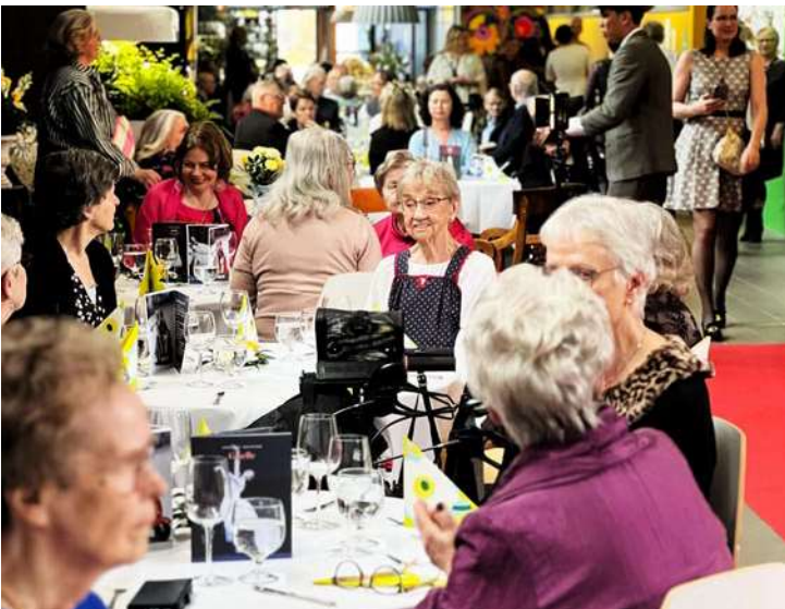
Kotioopperan yleisömäärä on kasvanut joka vuosi