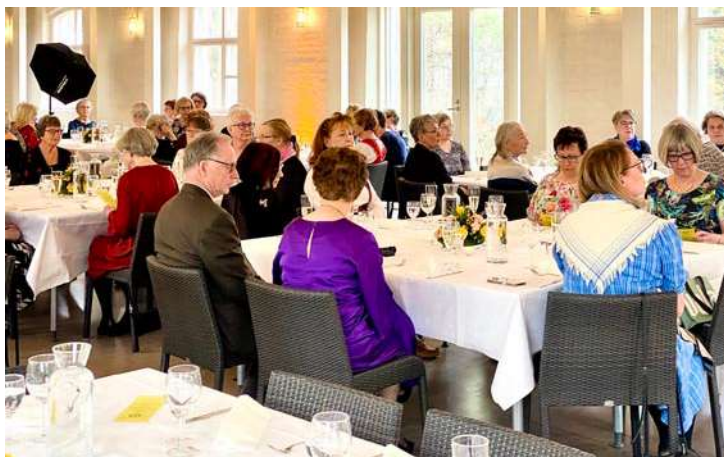
Juhlatunnelmissa niin Martat kuin Martit

huivit. Oli ilo katsella esitystä, jossa iloiset Martat esiintyivät ja voisi sanoa, että he antoivat itsestään kaiken. Yleisö ei ainakaan jäänyt kylmäksi! - Juhlailta päättyi kahvitteiluun ja yhdessä laulaen Marttalauluja.