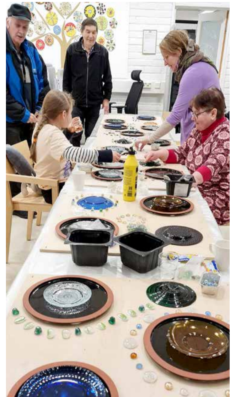
Mosaiikkilaattojen tekemiseen osallistuivat kaiken ikäiset kävijät.

Yksi nuori kävijä on tuonut Iltatoukkariin lähes joka tiis-