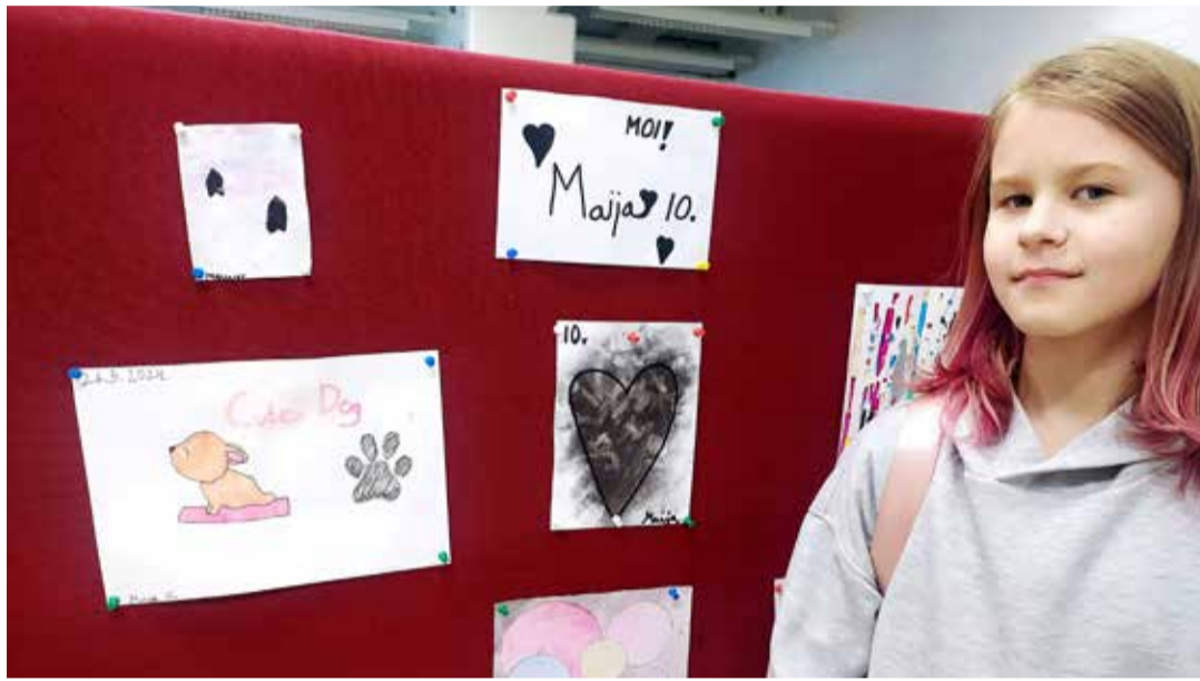
Maijalla on paljon erilaisia teoksia, joista jokainen on taidokkaasti tehty.

Saimme nauttia herkullisista kahvion antimista sekä karaoken laulesityksistä.