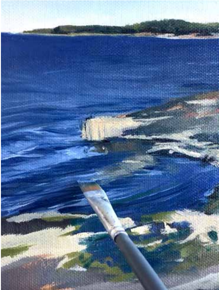
Each painting is carefully painted with many brushstrokes and details. // Jokainen maalaus on huolella ja tarkasti maalattu useilla siveltimen vedoilla ja yksityiskohdilla.