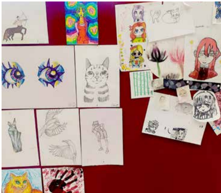
Kevään aikana tehtyjä taideteoksia.