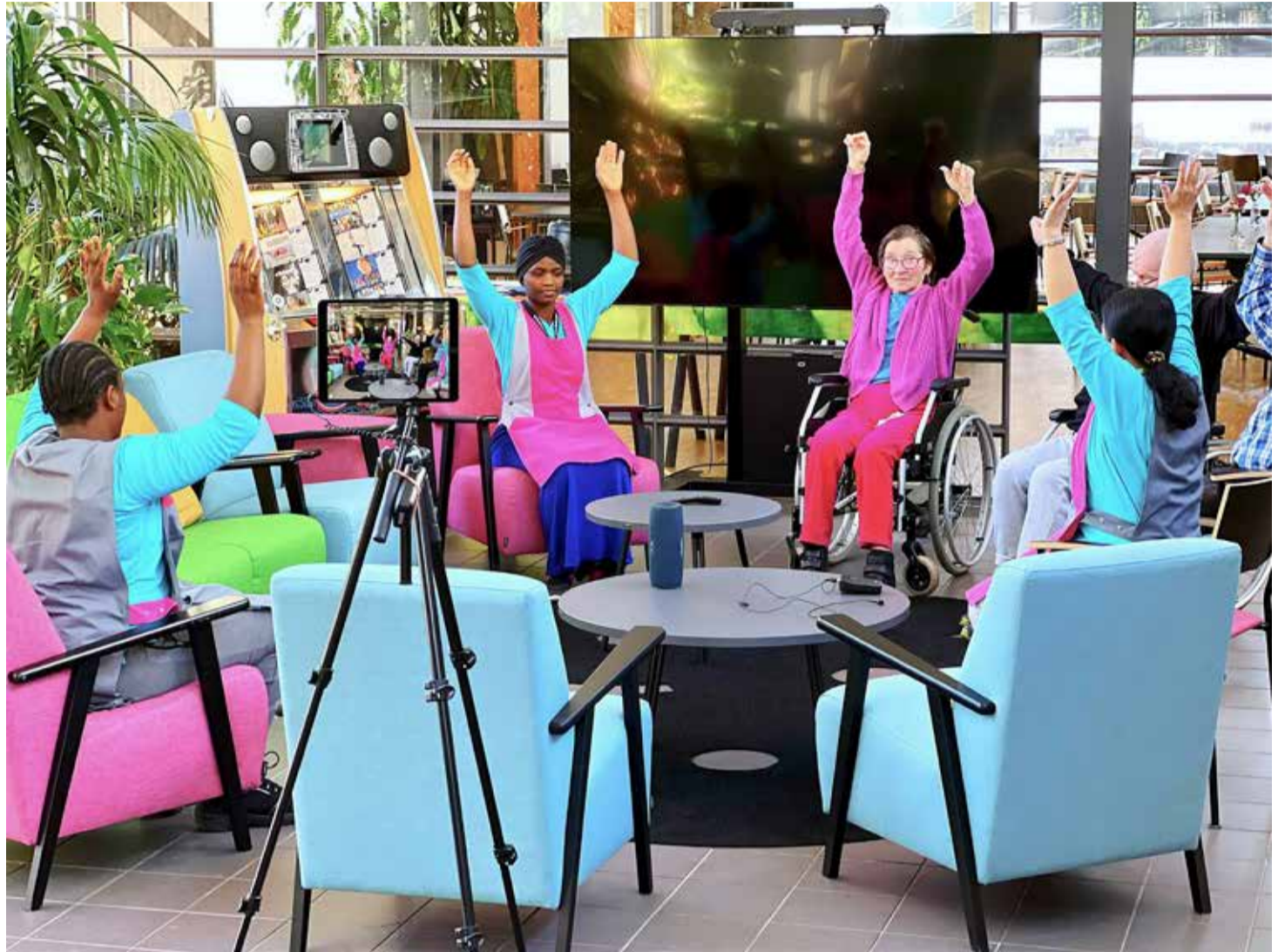
Aamulähetyksen ja tuolijumppaa kuvataan Youtubeen joka arkiamu.