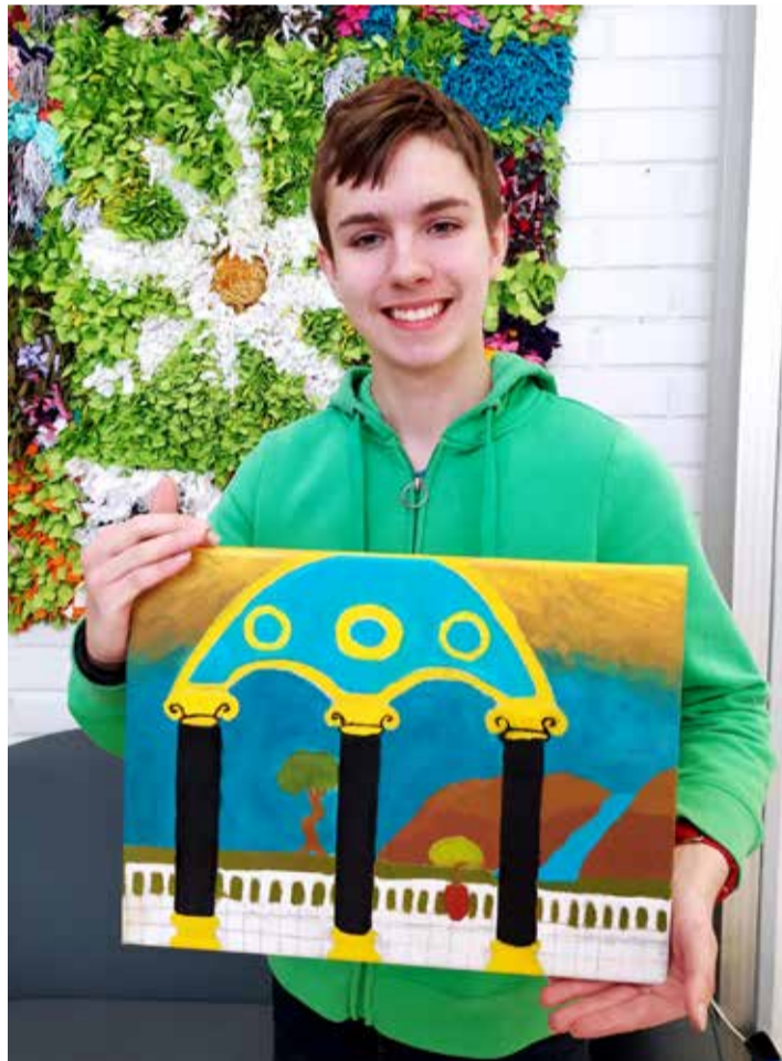
Kimmon tekemä taidokas öljyvärimaalaus.