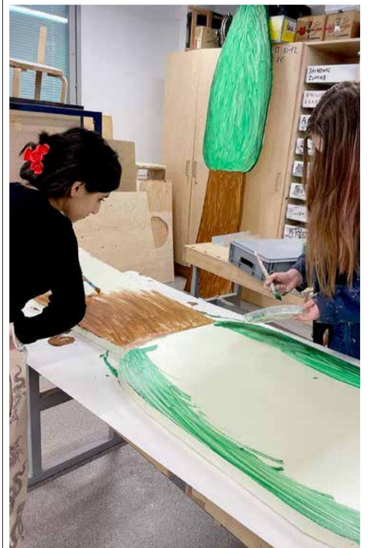
Oppilaat tekivät itse myös näytelmän lavasteet.

Esityksen valmisteluun osallistuneen kommentti: Esitys meni hyvin, meillä oli paljon ongelmia ja teimme paljon virheitä harjoituksissa, mutta selvisimme kaikesta. Teimme kaikki koristeet omin käsin ja usein viivyimme koulussa pidempään kuin oli tarpeen.