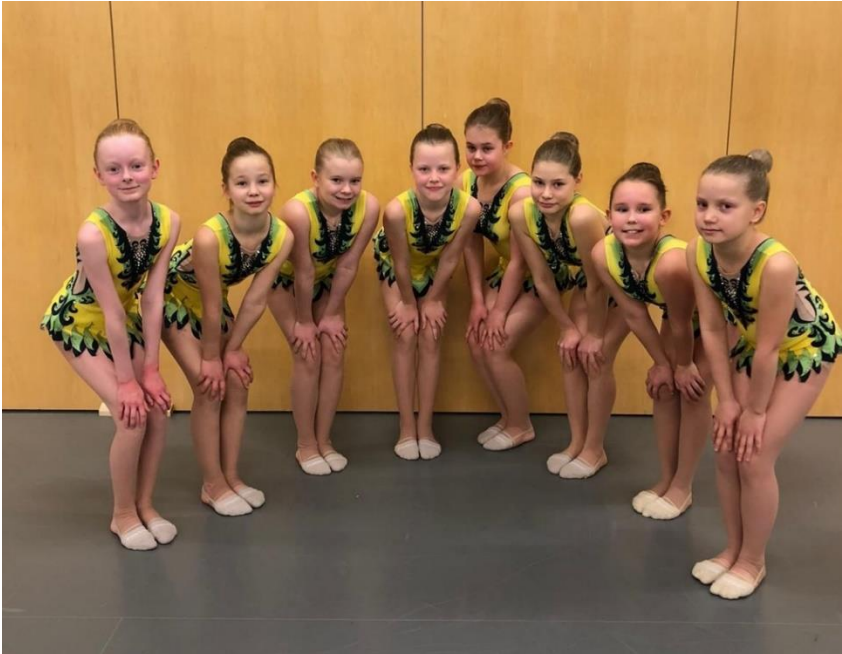
Kuva 14. Neeliat harjoitteli kahdesti viikossa.