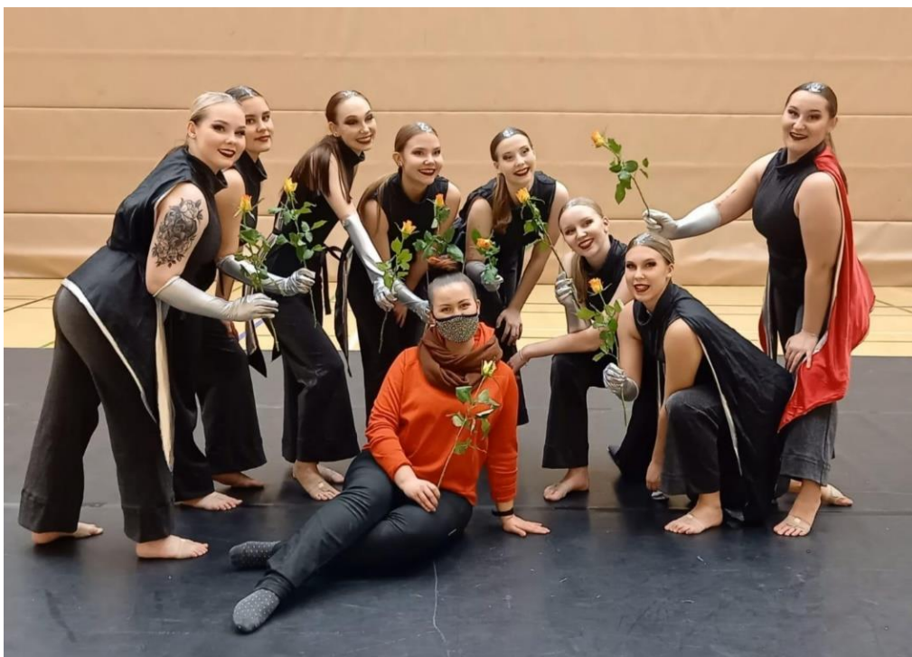
Kuva 10. Satelliitit sijoittui kolmanneksi marraskuun etä-Lumossa Naantalissa.