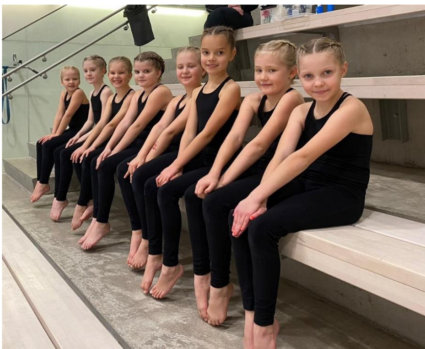
Kuva 12. Nelissat osallistui syyskaudella Stara-tapahtumiin ja kevätkaudella 8-10v virtuaalikelkilpailuihin.