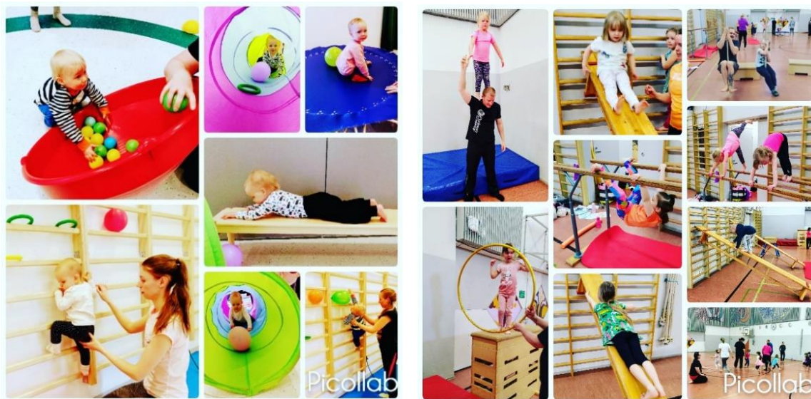
Kuva 6. Perheliikuntaryhmien toimintaa esiteltiin sosiaalisessa mediassa.

Kaudella 2020-2021 kokoontui kolme perheliikuntaryhmää 1-vuotiaista 4-vuotiaisiin. Perheliikunnan tavoitteena on antaa lapselle sekä heidän kanssaan liikkuvalla aikuisella yhteisiä kokemuksia ja onnistumisen elämyksiä liikunnan parissa ja samalla rakentaa terveyttä edistävän liikuntaharrastuksen pohjaa. Koronaviruspandemian takia perheliikuntaryhmät keskeyttivät toimintansa marraskuun lopussa – eivätkä ne saaneet palata enää takaisin saleihin kauden aikana. Harrastajille palautettiin puolet toimintamaksusta tai annettiin mahdollisuus siirtää maksu seuraavalle toimintavuodelle.