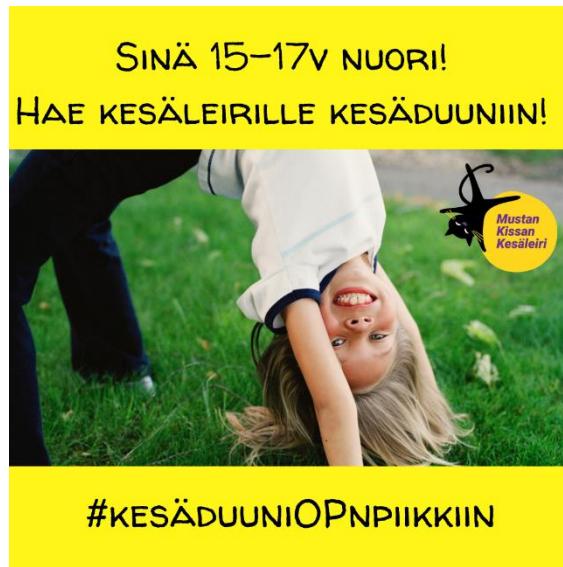
Kuva 21. Kesäleiri työllisti nuoria ja mahdollisti lapsille hauskan ja liikunnallisen kesäloman aloituksen.

Kesäleirin toteuttamiseksi saatiin Mäntsälän Osuuspankilta ”Kesäduuni”-stipendejä, joilla palkattiin ryhmärit lasten leiripäivien tueksi. Lisäksi leirin ruokahuolto toteutettiin vapaaehtoisten avustuksella.