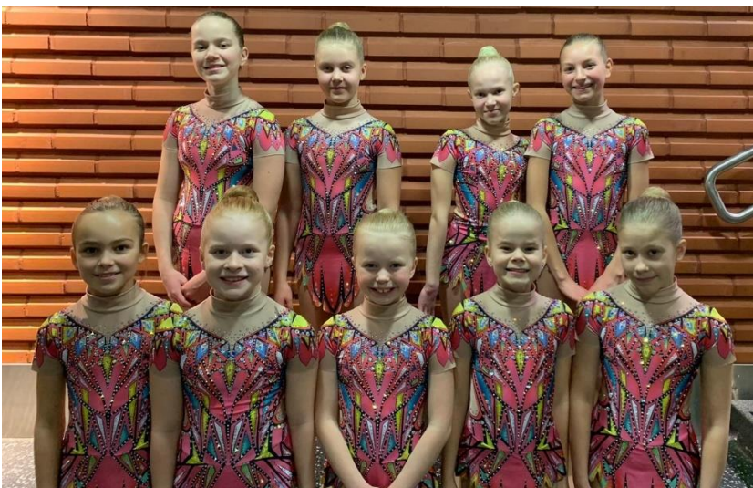
Kuva 15. Liliat-joukkue saavutti hyviä kategorioita kilpailuissa.