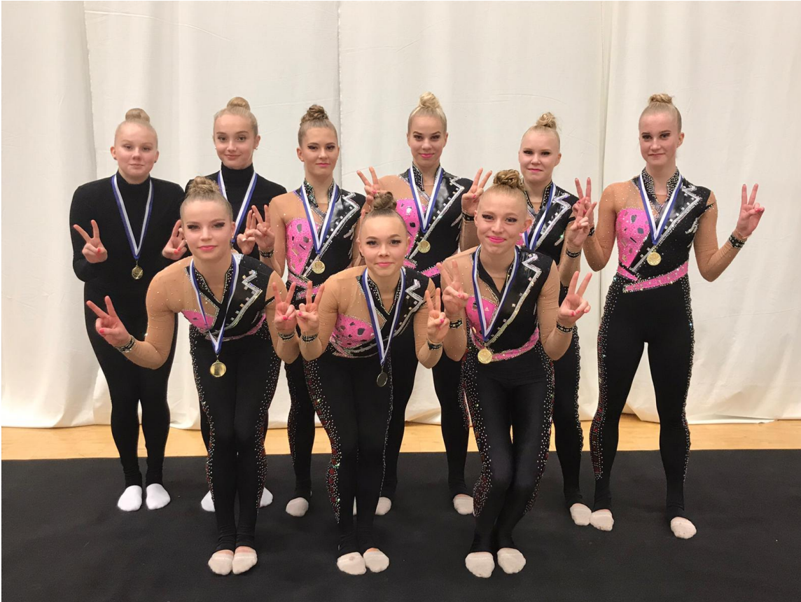
Kuva 4. HJM-yhteistyö päätettiin kesäkuussa. Kuvassa Team Freyat, jossa voimisteli MäV-urheilijoita.