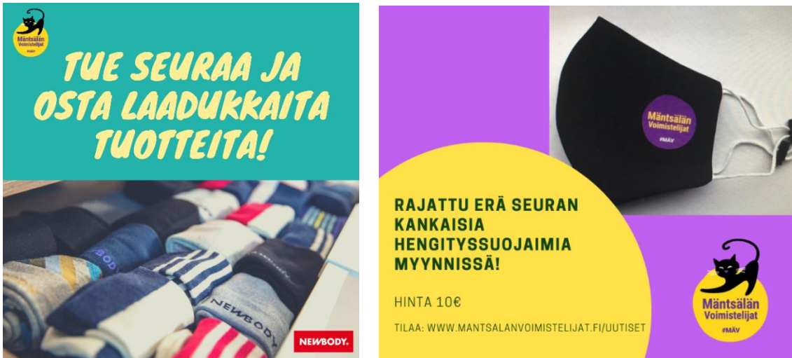
Kuva 24. Seura toteutti eri varainhankintakampanjoita talouden tasapainottamiseksi.