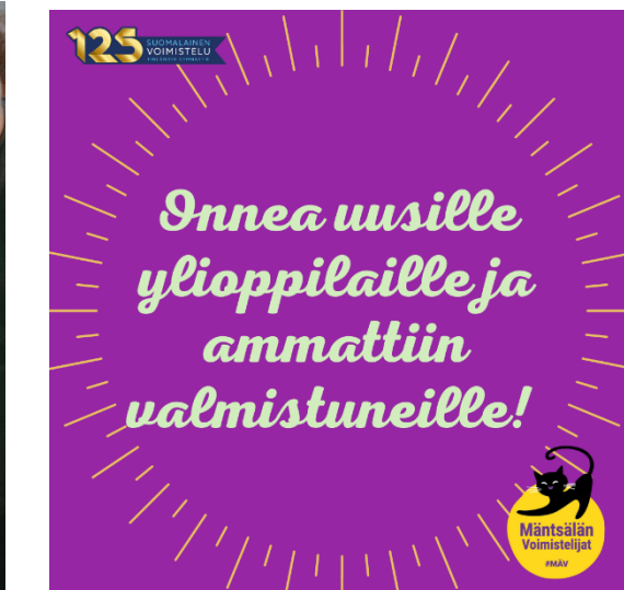
Kuva 26. Sosiaalisessa mediassa julkaisuja tehtiin säännöllisesti eri aiheista.

Paikallislehtiin (Mäntsälän Uutiset, Mäntsälän Sanomat) toimitettiin juttuja koskien tuntitarjontaa ja kilpailuja. Lehdet julkaisivat pääsääntöisesti kaikki seuran lähettämät tekstit ja kuvat. HJM-yhteistyöjoukkueiden tiedotteet toimitettiin paikallislehtiin seuran kautta osana seuran omia kisatiedotteita.