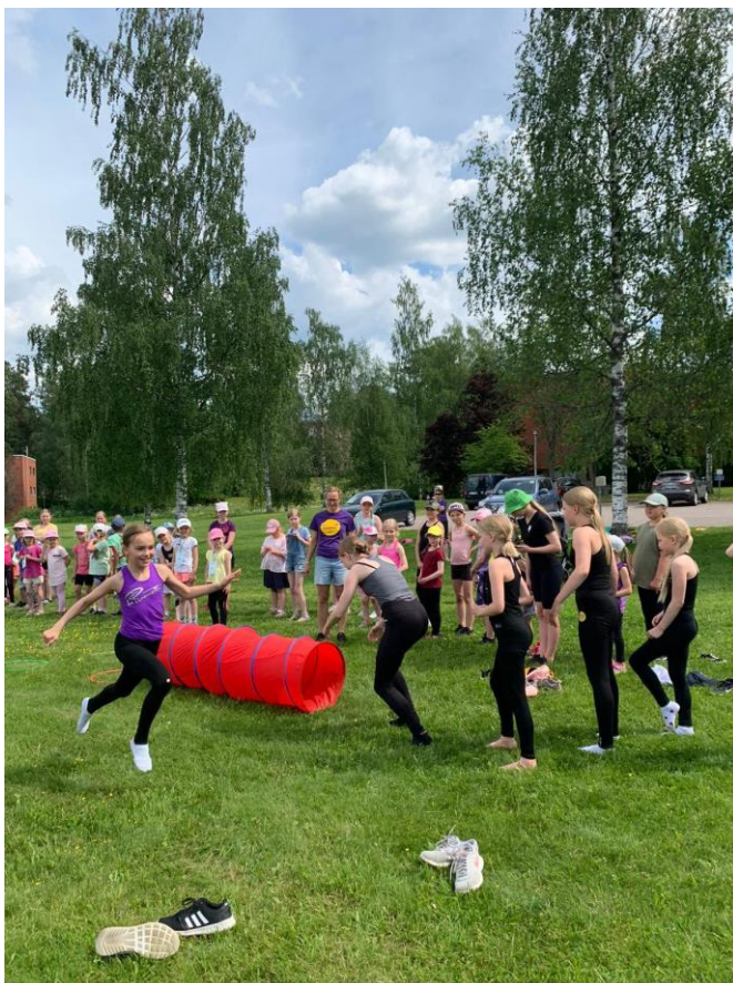
Kuva 22. Kesäleiri päättyi yhteisiin leirileikkeihin.

Kesäleirin toteuttamiseksi saatiin Mäntsälän Osuuspankilta ”Kesäduuni”-stipendejä, joilla palkattiin ryhmärit lasten leiripäivien tueksi. Lisäksi leirin ruokahuolto toteutettiin vapaaehtoisten avustuksella.