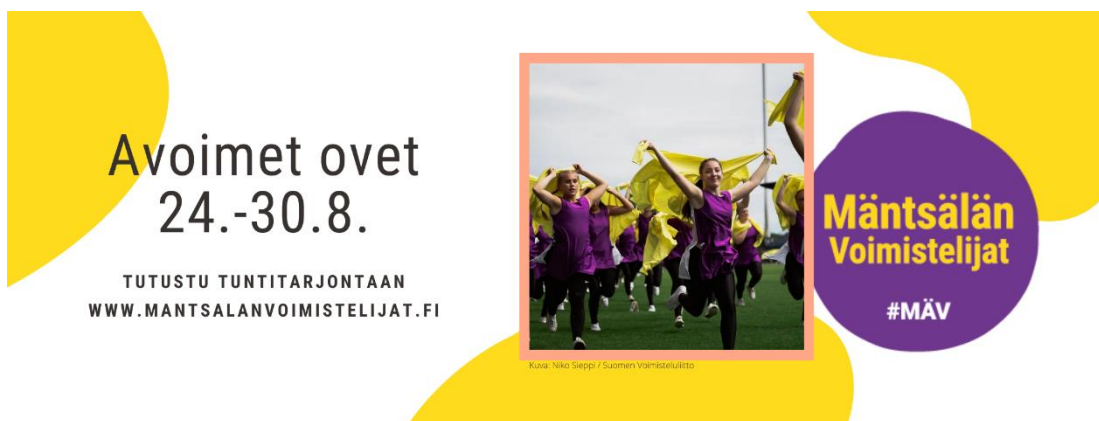
Kuva 5. Kausi käynnistyi usealla markkinointitapahtumalla elokuussa 2020.