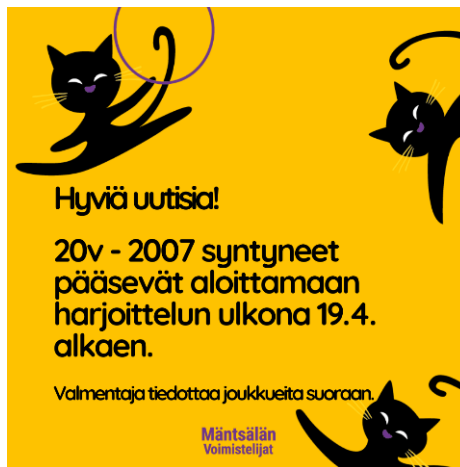
Kuva 8. Kevään aikana päästiin takaisin saleihin erikoisjärjestelyin.