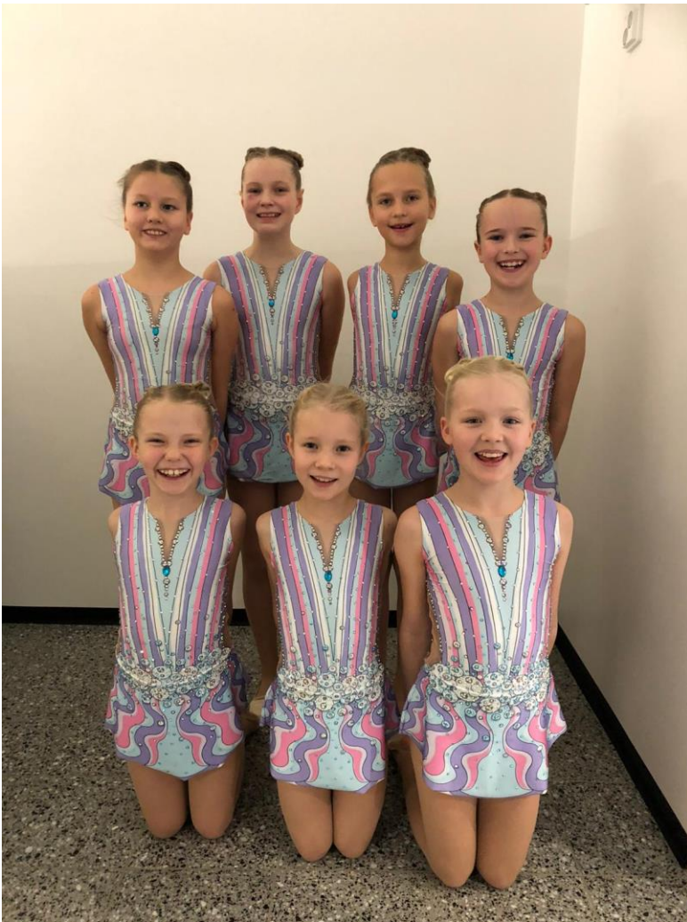
Kuva 13. Lilat osallistui ahkerasti kilpailuihin.