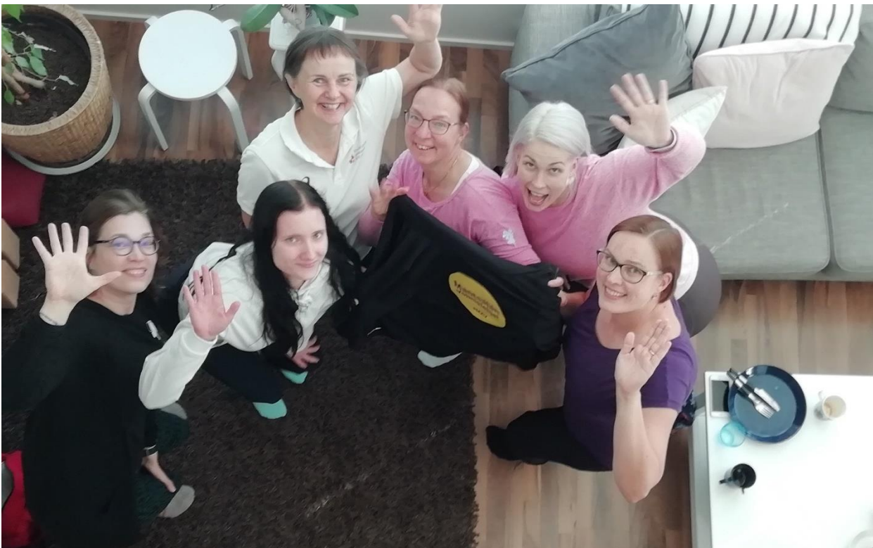
Kuva 23. Hallitus kokousti yhteensä 19 kertaa – pääosin etänä.