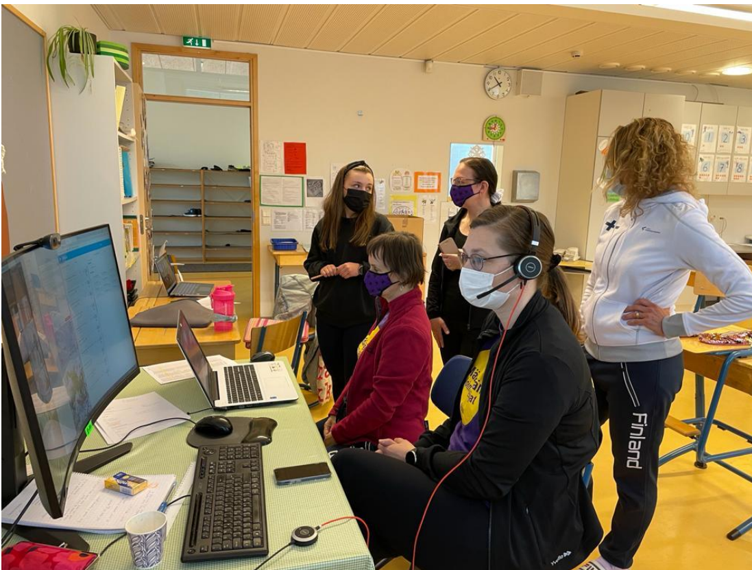
Kuva 20. Mustan Kissan Cup toteutettiin virtuaalisesti Myllymäen koulun luokista.

Kevätkaudella Mustan Kissan Cupia siirrettiin useaan otteeseen, ja se järjestettiin lopulta virtuaalisesti lauantaina 22.5.2021. Kilpailuun osallistui 84 joukkuetta. Seuratoimijat joutuivat venymään uusien teknisten haasteiden edessä, mutta lopulta kilpailu saatiin onnistuneesti toteutettua ennen kaikkea muiden voimisteluseurojen oppien avulla.