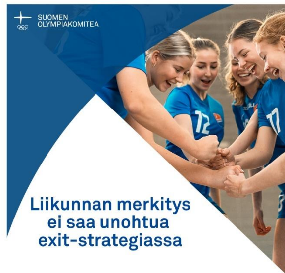
Kuva 27. Seura viesti myös ajankohtaisista teemoista urheilun ja voimistelun maailmassa.

Mäntsälän Ykkösapteekki oli seuran yhteistyökumppanina. Apteekin kanssa tehtiin myös viestinnällistä yhteistyötä sosiaalisessa mediassa liittyen apteekin muovipussituottojen lahjoitukseen seuralle. Apteekki oli mukana kauden Lähtölaukaus-tapahtumassa elokuussa ja helmikuussa järjestettiin etäjumppa apteekin asiakaskunnalle osana seuran tunteja.