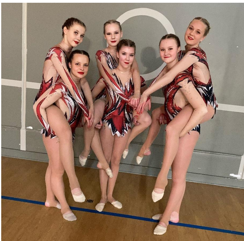
Kuva 16. Minea-joukkueen kisakausi kesti poikkeuksellisesti kesäkuuhun asti.