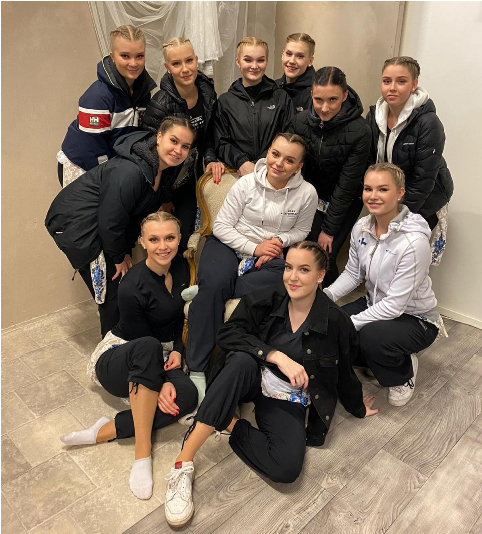
Kuva 17. Hengettäret jr kilpaili usein mitaleille H16-20v-sarjassa.