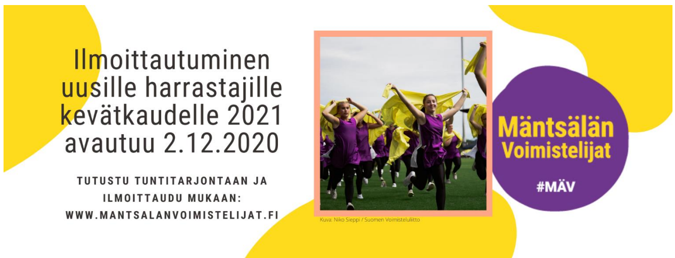
Kuva 25. Markkinointia tehtiin pääasiassa sosiaalisessa mediassa.

Viestintää ja markkinointia toteutettiin monikanavaisesti eri viestintävälineissä. Viestintätiimi linjasi päätoimenpiteet, joita toiminnanjohtaja sekä lajivastaavat toteuttivat. Toimintavuoden viestintä kohdistui pääosin koronavirusepidemian aiheuttamiin jatkuviin muutoksiin. Kauden alussa markkinointia tehtiin laajalle kohderyhmälle, mutta rajoitusten astuessa voimaan painopiste siirtyi jäsenistön sisäiseen viestintään.