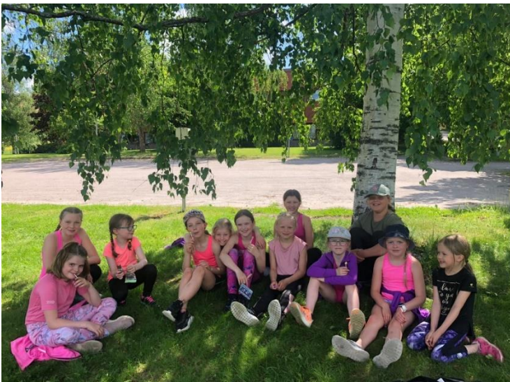
Kuva 2. Mustan Kissan kesäleirillä oli hellettä.

Kesäkausi saatiin toteutettua melko normaalisti. Mustan Kissan kesäleiri saatiin järjestää – tällä kertaa se toteutettiin päiväleirinä monitoimitalolla noin 50 lapsen voimin. Joukkuevoimistelijat jatkoivat harjoituksiaan juhannukseen asti ja kesäjumppa veti mukavasti liikkujia helteisinä kesäpäivinä. Uuden kauden suunnittelu aloitettiin kesäkuussa, kun kunnan salivuorot saatiin seuraavalle kaudelle.