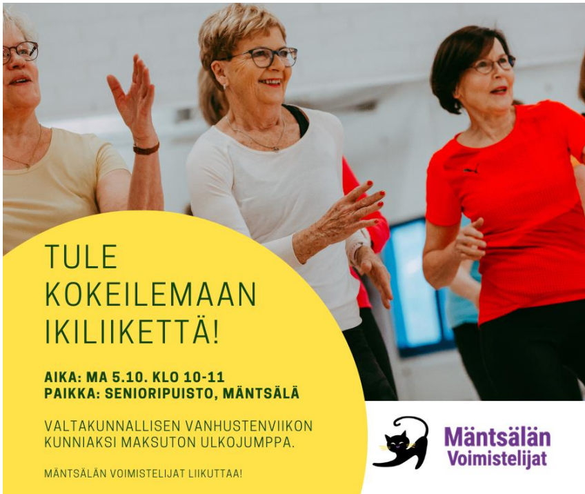
Kuva 18. Syyskaudella tarjottiin ulkojumppaa vanhustenviikon kunniaksi.

Toimintavuona jatkettiin Treenikortti-käytäntöä: jäsenet pystyivät hankkimaan Rajaton-, 30x- tai 10x -treenikortin, jolla sai käydä haluamillaan tunneilla. Joogaryhmiin oli erillinen ilmoittautuminen ja lisämaksu. Rajaton-treenikortin hankki yhteensä 43 liikkujaa, 30x-kortin yhteensä 13 liikkujaa ja 10x-kortin yhteensä 8 liikkujaa. Joogaryhmissä oli mukana 28 henkilöä. Aikuisten ryhmiä ohjasi neljä eri ohjaajaa.