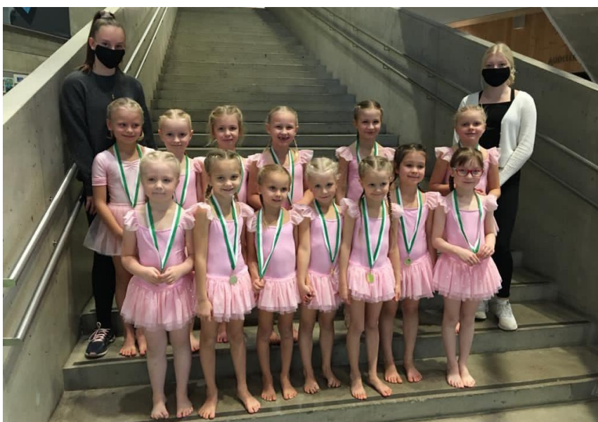
Kuva 11. Vauhtiheitot pääsi vihdoin osallistumaan Stara-tapahtumaan marraskuussa.

Kilpailut: Stara 8.11.2020, Tapiola Stara, Espoo