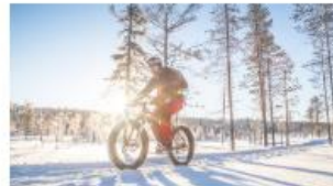
MAASTOPYÖRÄILY, PALLAS-YLLÄSTUNTURIN KANSALLISPUISTO