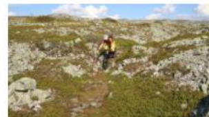
MAASTOPYÖRÄILY, PALLAS-YLLÄSTUNTURIN KANSALLISPUISTO