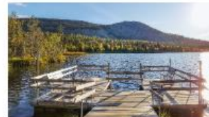
MAASTOPYÖRÄILY, PALLAS-YLLÄSTUNTURIN KANSALLISPUISTO