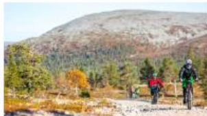
MAASTOPYÖRÄILY, PALLAS-YLLÄSTUNTURIN KANSALLISPUISTO