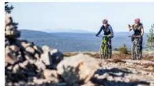
MAASTOPYÖRÄILY, PALLAS-YLLÄSTUNTURIN KANSALLISPUISTO