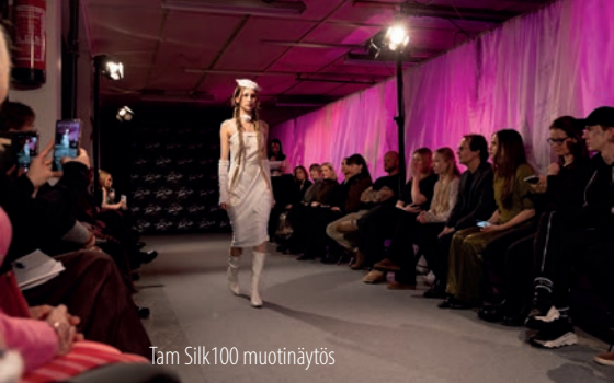
Tam Silk100 muotinäytös