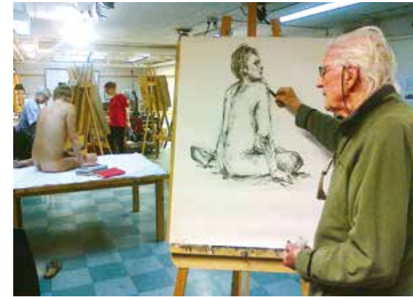
Sasekalla piirtämässä tänä syksynä.

– Olin Osuusliike Voimassa somistajajarjoittelijana kesän 1946, Helsingin