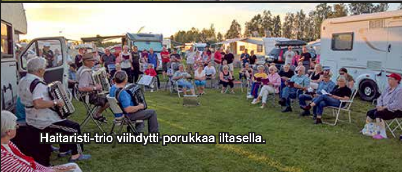
Haitaristi-trio viihdytti porukkaa iltasella.