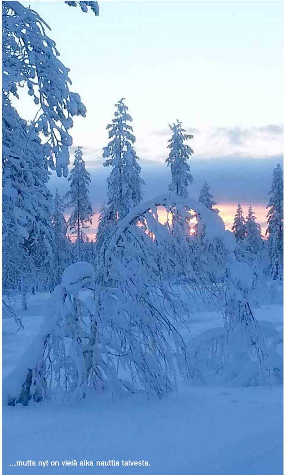
...mutta nyt on vielä aika nauttia talvesta.