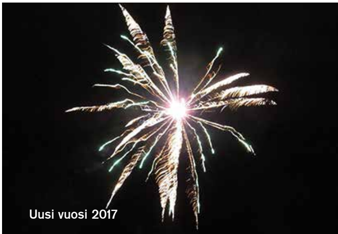
Uusi vuosi 2017