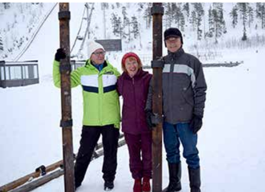
Tandemhiihdon voittajajoukkue Pohjois-Karjala.