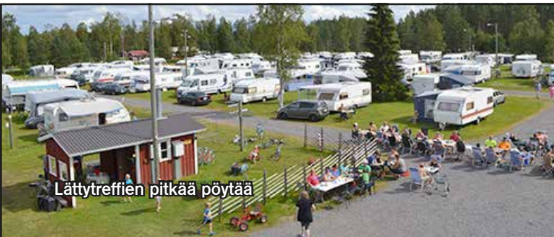
Lätytreffien pitkää pöytää