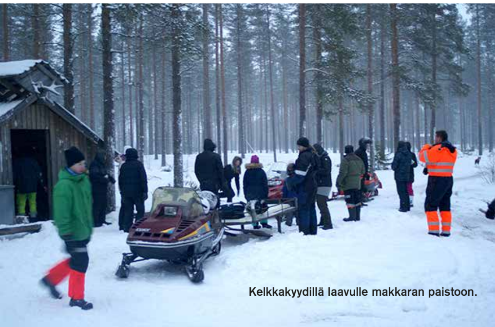
Kelkkakyydillä laavulle makkaran paistoon.