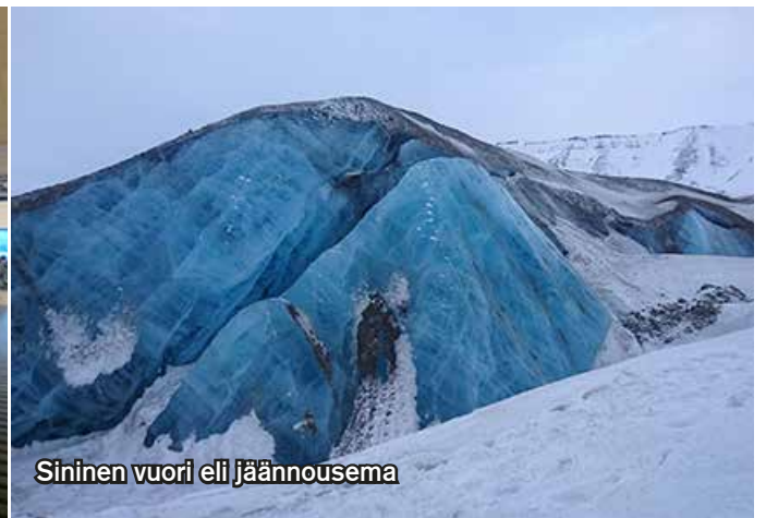
Sininen vuori eli jäänouset