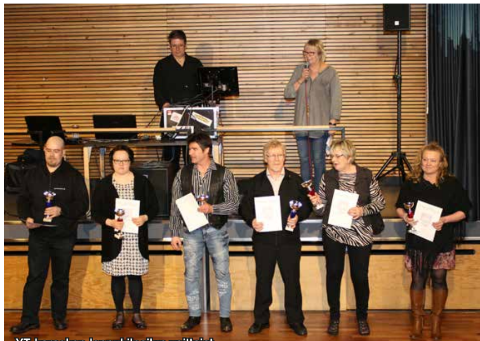
YT-karaoken loppukilpailun voittajat