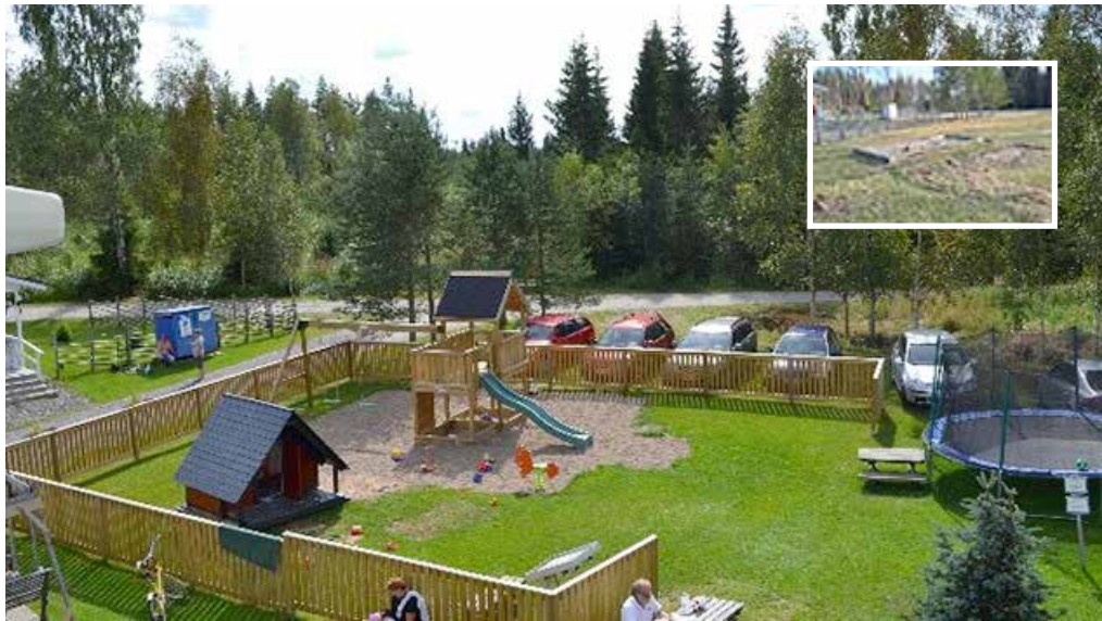
Uusittu leikkipuisto on lasten suosikkipaikka.

Kesän 2016 nuorimmainen karvanaamari käy jo tottuneesti koirapuistossa.