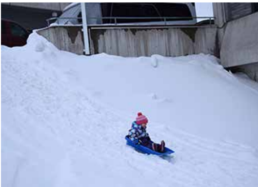
Lasten pulkkakisassa mentiin lujaa.