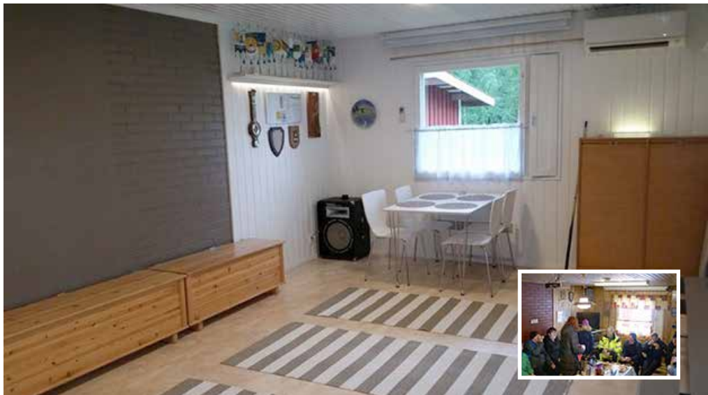
Takkatupa koki täydellisen muodonmuutoksen talkoolaisten käsissä.