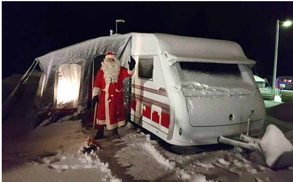
Alueella on ilmeisesti kilttejä karavaanareita, koska joulupukki kävi kolkuttelemassa vaunumme ovelle.

Ensi kesäksi on toiveissa saada kesä- paikka myös Rantasarasta. Olisi mu- kava nähdä, miten kesän vietto täällä sujuu.