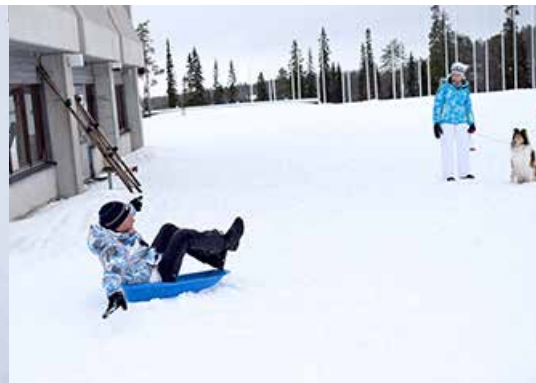
Pulkalla lapset ensin ja aikuiset perässä ja tyyli on vapaa.