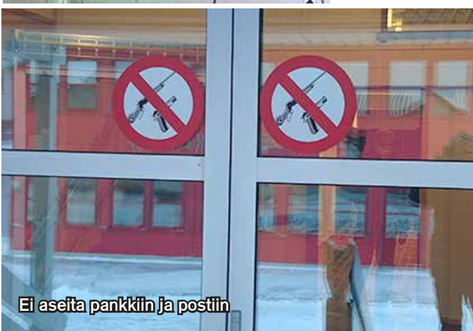
Ei aseita pankkiin ja postiin