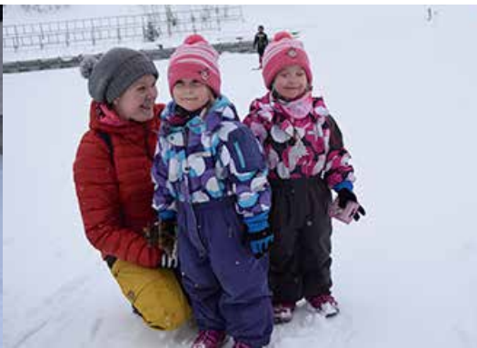
Voittajat poseeraa aidosti.