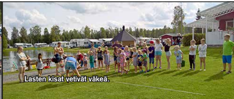
Lasten kisat vetivät väkeä.