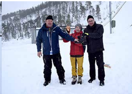
Monoheittokisan voittaja joukkue Koillismaa.