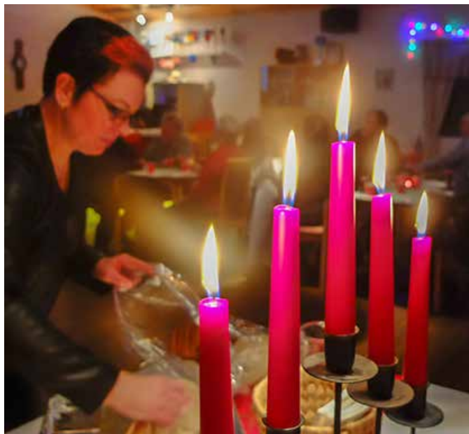
SF-Caravan Napapiirin pikkujouluja vietettiin perinteisin me- noin 25.11.2016.