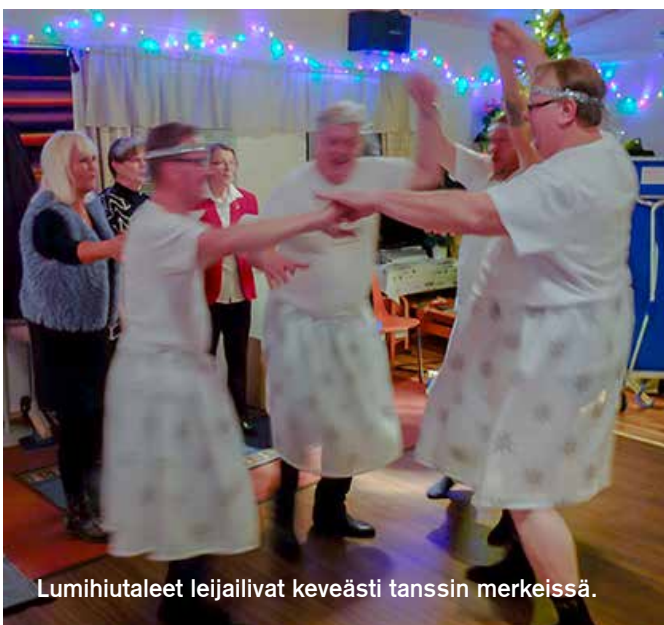
Lumihiutaleet leijailivat keveästi tanssin merkeissä.