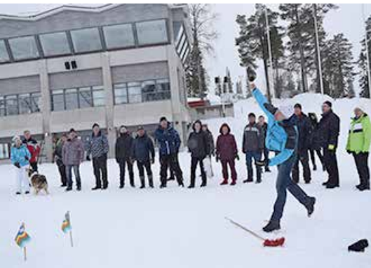
Tästä se lähtee, mono meinaan.