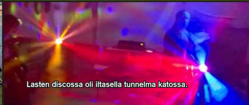
Lasten discossa oli iltasella tunnelma katossa.