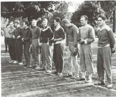
Pesäpallo-ottelut toisten ylioppilaskotien kanssa toivat yhteyksiä ulos päin, voitot nostivat itsetuntoa. Hilman kakkukahvit olivat paikintona.

Sain kutsun ylioppilaskotimme asukkaaksi aloittaessani teologian opiskeluni syksyllä 1960. Lämmin lestadiolainen pirttikristillisyyden ilmapiiri otti vastaan fuksiteologin auttavana, holhoavana ja kaikki ongelmat selvittävänä. Suurin osa asukkaista oli teologian opiskelijoita. Minua tervehdittiin kyselemättä Jumalan terveellä. Minulle opastettiin suorin kulkureitti Fredrikinkadun seurahuoneelle 61 A ja varoitettiin rappukäytävästä B. Minut otettiin jäseneksi vanhempien veljien saunaporukkaan. (Se oli muuten edelliseltä vuosikymmeneltä peräisin