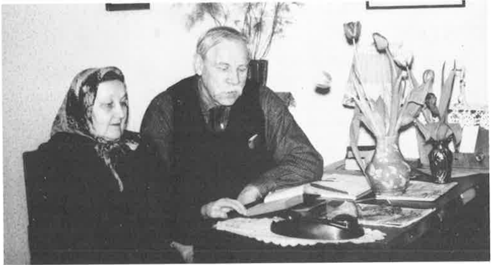
Ylioppilaskodin uskollisimpia ystäviä läpi vuosikymmenien olivat Jutilan täti ja setä. Heidän kotinsa ensin Eerikin-, sitten Pursimiehenkadulla oli monien opiskelijapolvien retriittipaikka.

kanssa. Myös jokapäiväiset iltahartaudet iltateen yhteydessä kuuluivat asiaan. Niistä oltiin poissa vain pakosta. Iltahartauksien pitäminen kuului talossa asuville teologipojille. Teologityttöjä tai muita opiskelijoita ei moiseen kelpuutettu. Tänä asiaa ajatellen tuntuu kummalliselta, ettei meille tytöille edes tarjottu iltahartausvuoroja, vaikka meille tiedekunnan käytännöllisissä harjoituksissa opetettiin hartauksien tekemistä ja pitämistä, Onneksi seuraavalle vuosikymmenelle tultaessa tilanne oli jo toinen.