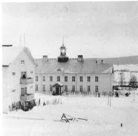
Ylitornion kansanopisto talvisessa asussaan.