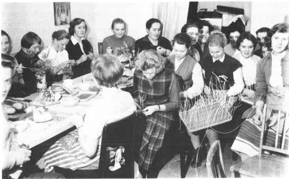
Hilma-emäntä talkooväkensä keskellä. Joukko kodin asukkaita ja ystäviä on kokoontunut ruokasaliin myyjäisiä valmistelemaan.