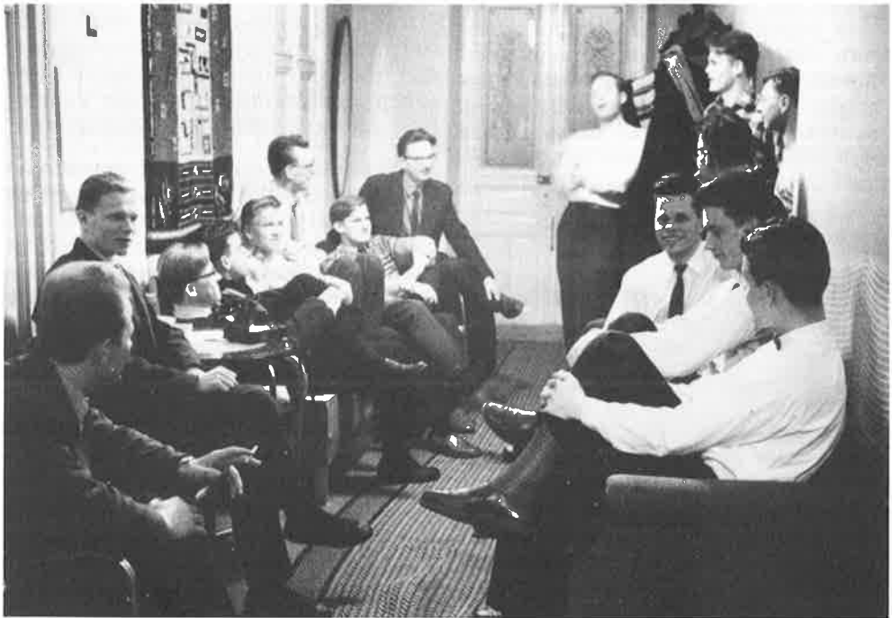
Käytäväkeskustelut olivat ensimmäisten opiskelijapolvien elämässä vaikuttavin instituutio. Ne ovat säilyttäneet asemansa muutostenkin paineissa.

Ylioppilaskodin perustamisen aikana ja sen alkuvuosina useimmat opiskelijat