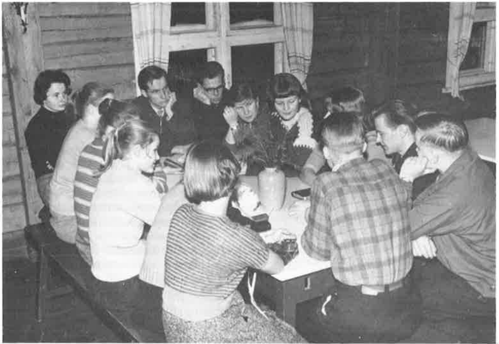
Retket Ylitornion talvipäiville toivat virkistävän katkon kevätlukukauteen. Keskustelu käynnissä opiston ruokala-aulassa.

sa. Tuntui kodikkaalta tulla Tansaniaan, näiden lämpimien, ystävällisten ja osaa-ottavien ihmisten pariin. Ihmiset täällä ovat samanlaisia kuin mantereen länsipuolella, Angolassa, jossa lähes päivittäin vierailen ajatuksissani. Tansaniakin