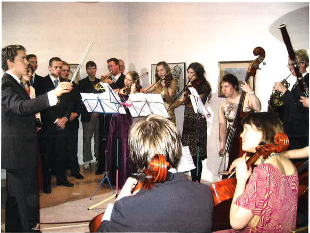
Kodin arkea värittävät nykyisinkin lukuisat yhteiset juhlat. Kuvassa on Kodin asukkaista ja heidän ystävistään koottu sinfoniaorkesteri esiintymässä perinteeksi muodostuneessa itsenäisyyspäivän juhlassa vuonna 2008.