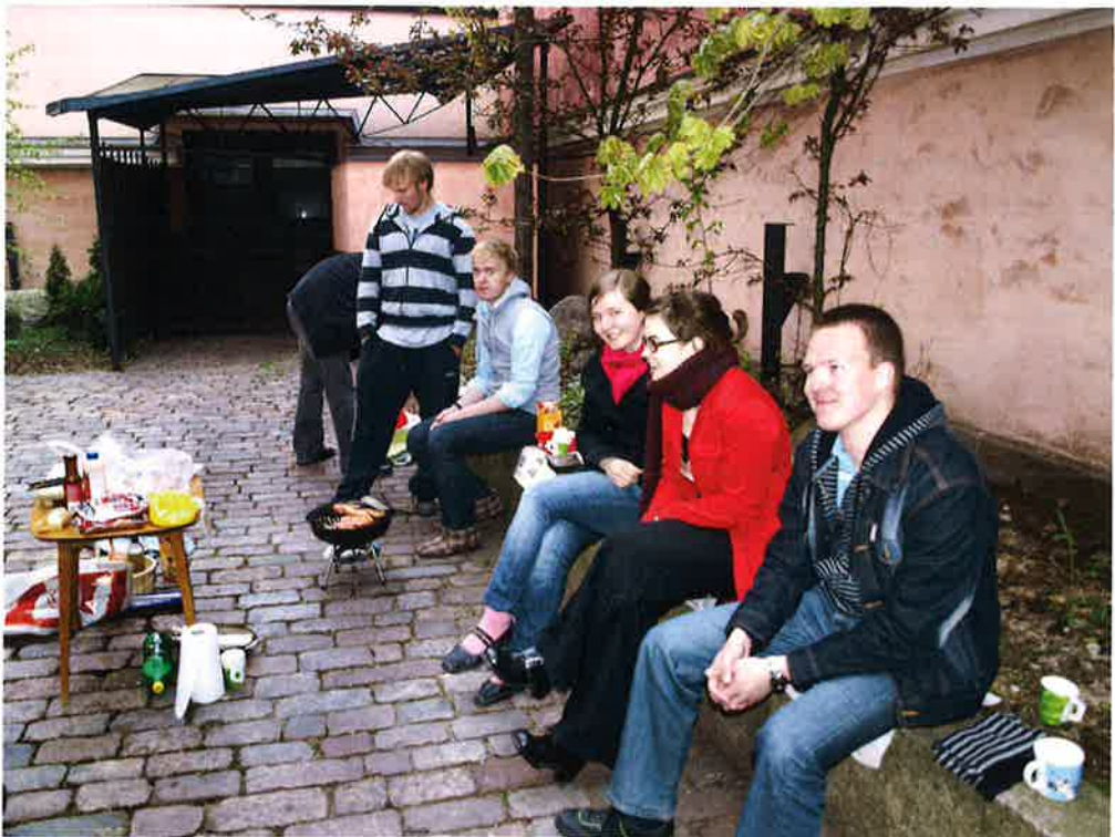
Keittiökeskusteluja voidaan käydä myös pihalla.