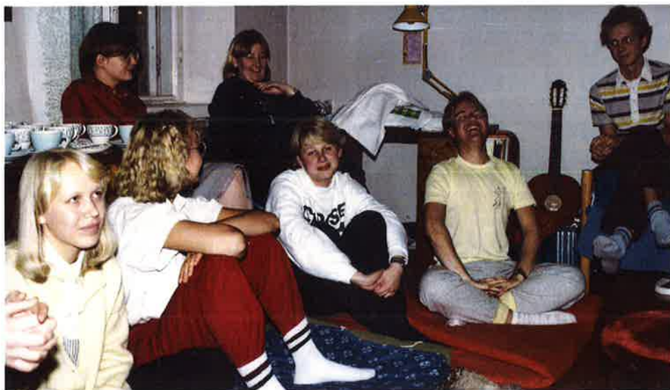
Tunnelmaa Ylioppilaskodissa 1983.