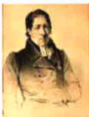
Lars Levi Laestadius 1800-1861

Keskustoimisto Kurikassa. Kansanopisto Kalajoella Heinäkallion leirikoti Kangasalalla. Paikallisyhdistyksiä n. 30 eri puolella Suomea. Päätapauhtuma: Kesäseurat Lehti: Lähettäjä Suomen Lähetysseuran yhteistyöjärjestö Laulukirja: Siionin matkalaulut