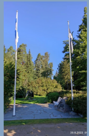
Kuvat: Raimo Laine, Kaj Höglund, Erja Saario