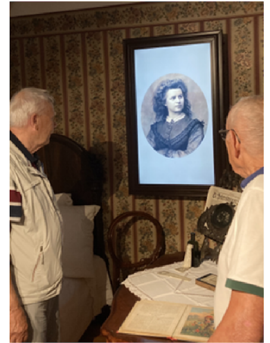
Teksti: Kaj Höglund

Maanantaina oli paluu Vaasaan ja arkeen. Vaasa-Pärnu Seuran retki oli jälleen kerran onnistunut ja mielenkiintoinen.