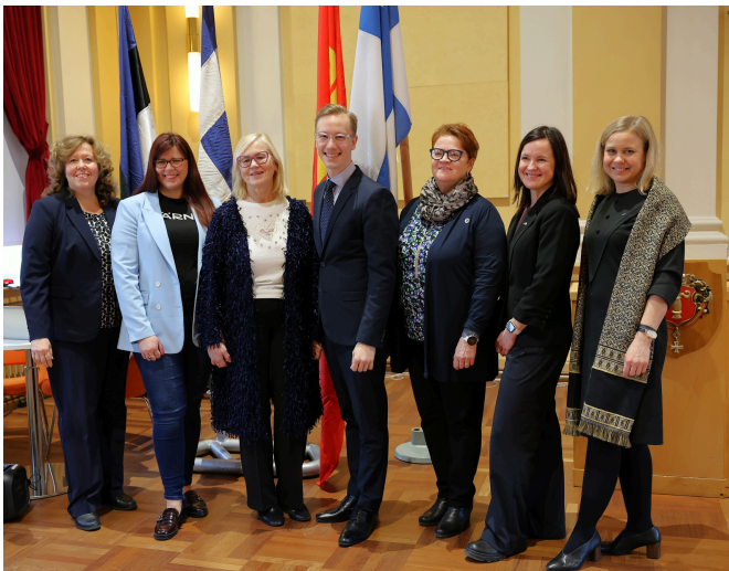
Vaasan ja Pärnun kaupunkien, Vaasa-Pärnu Seuran, Viron suurlähetystön ja SVYL:n edustajat