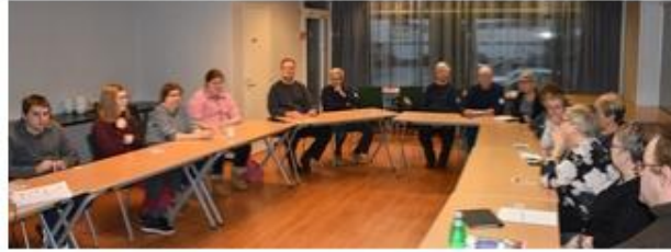
Lapin Metkat vaikuttamiskoulutuksessa.