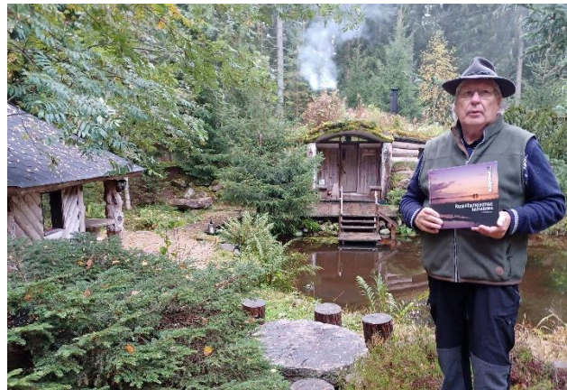
Kirjoittajan esittely (teksti Matti Vihurila)