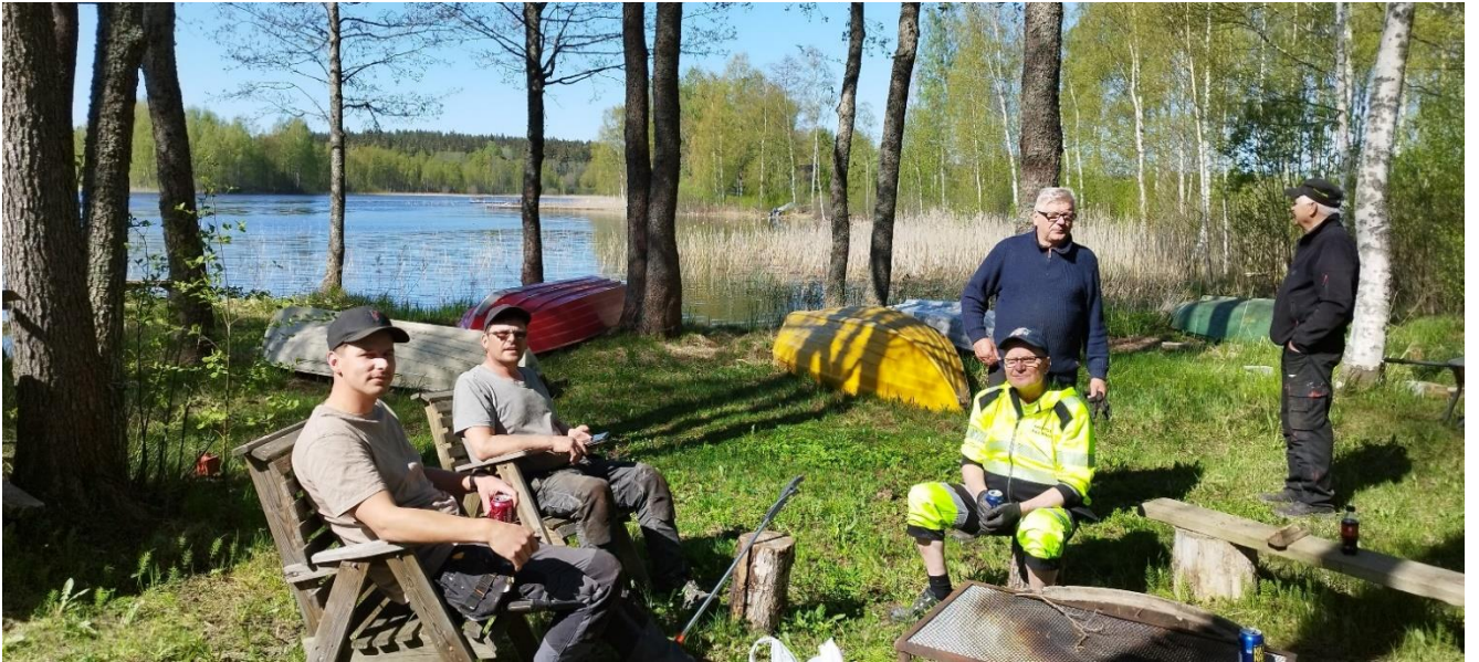
Lepohetki sataman nuotiopaikalla.