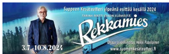
Rekkamies – musikaali

2000-luvun mukanaan tuoma teknologinen kehitys, muun muassa DNA-testaus, on kyennyt avaamaan ihmisille ovia muinaiseen esihistoriaan, sekä pystynyt yhdistämään johtolankoja, joita ei olla aikaisemmin kyetty näkemään ihmissilmin. Toisin kuin usein ajattelemme, kaikki ei ole sitä miltä näyttää. Se myös avaa uusia näkökulmia muinaiseen esihistoriaan, ihmisrodun kehitykseen, sekä maapallon asutuksesta vaeltavien kansojen ja heimojen toimesta. Kuka tietää, mitä tulemme löytämään ja selvittämään tulevien vuosien ja vuosikymmenten kuluessa.