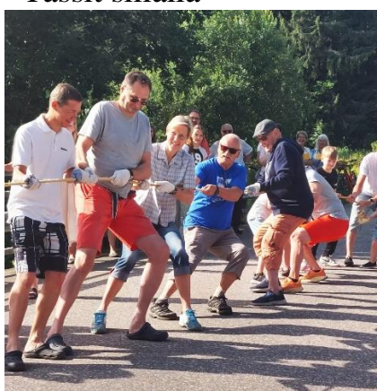
Köydenveto: kyläläiset vastaan kesäasukkaat.

Niin siinä kävi, että kesäasukkaat olivat parempia, niin kuin monesti aiemminkin.