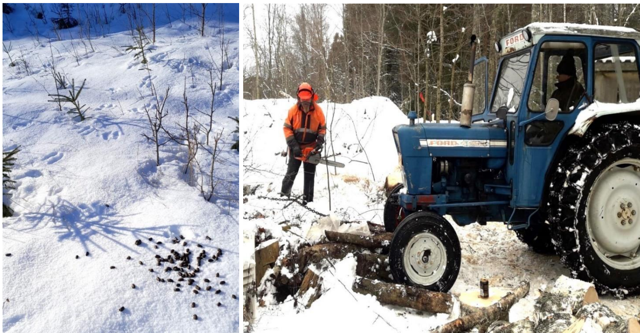
29.3.2024 Hirven jälkiä kantohangella ja pöllin tekoa.