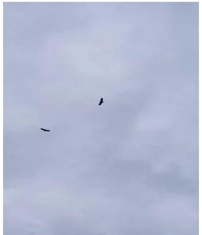
10.4.2024 Kotkat Niittyläntien yllä.