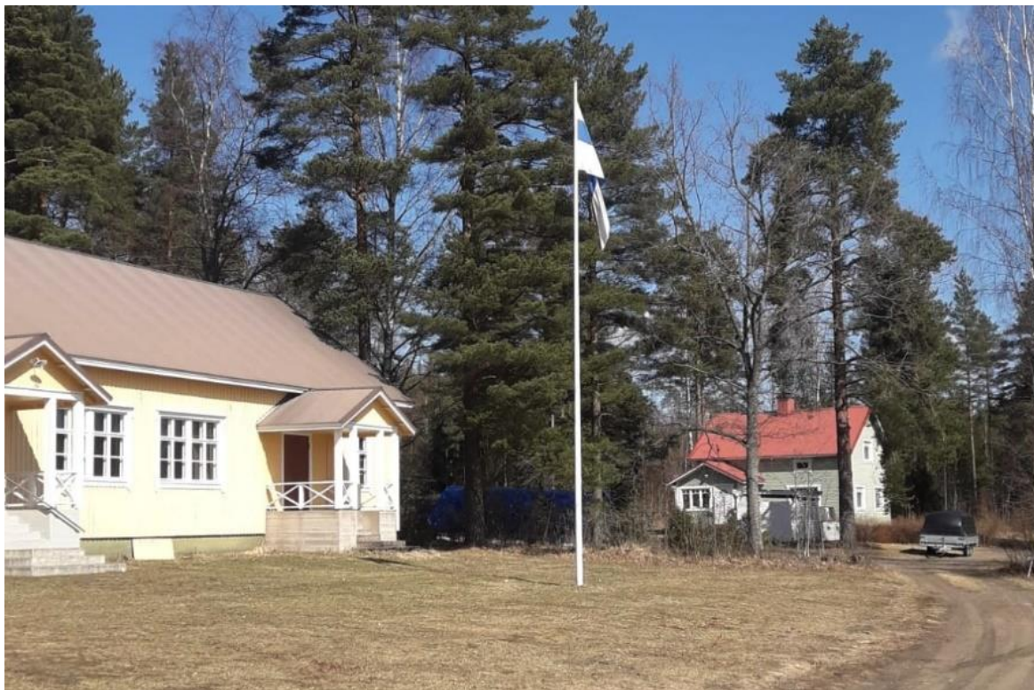
Vepari juhlapäivän aamuna.