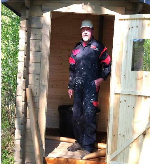
Leo. Sataman huussin maalausta