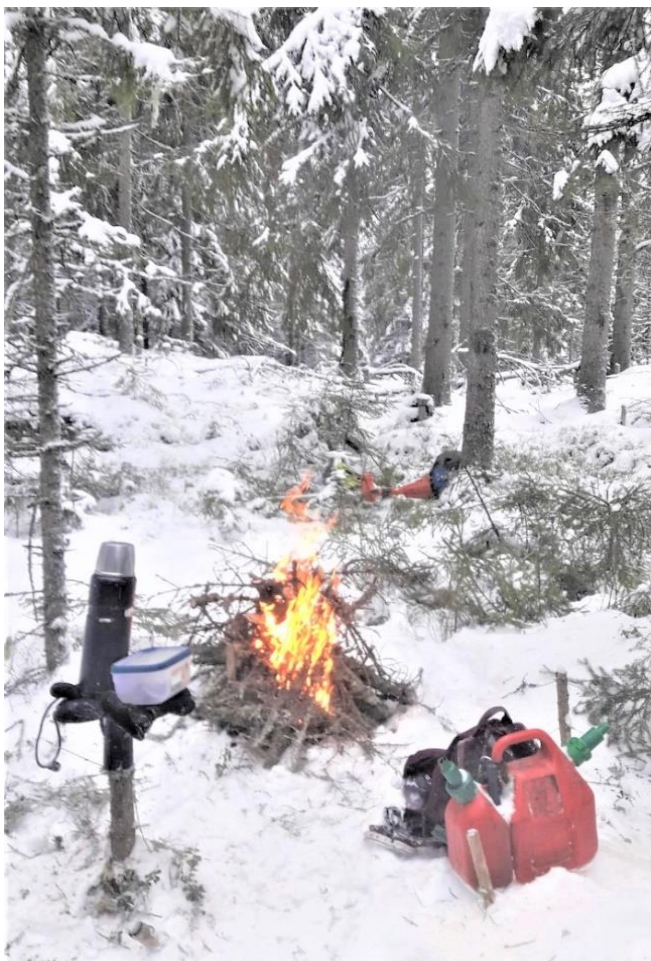
Kylällä nähtyä ja kuultua