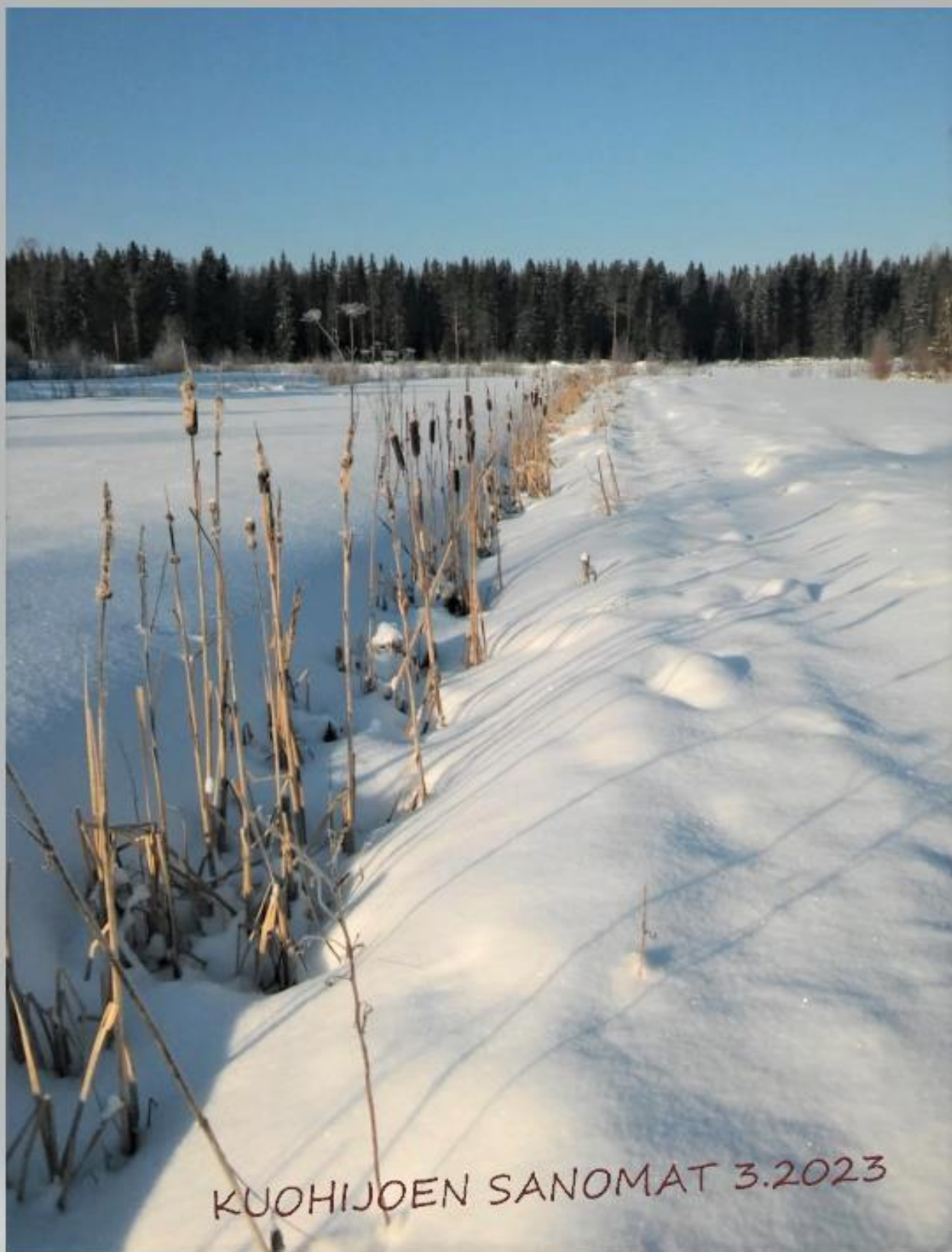
Osmankäämit Suopellon reunalla 21.2.23