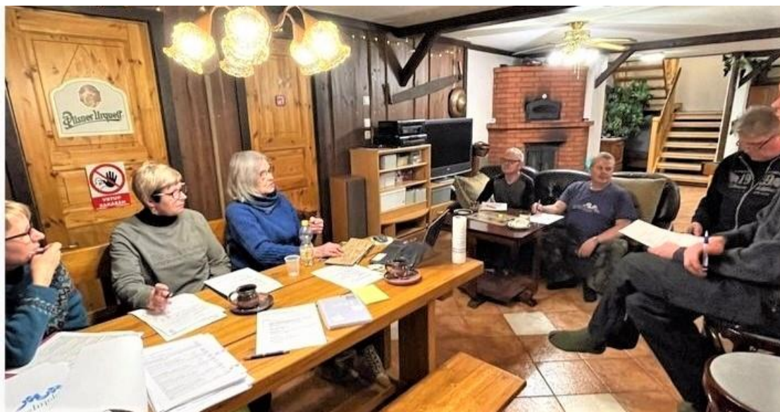
6.3.2023 Hallituksen istunto