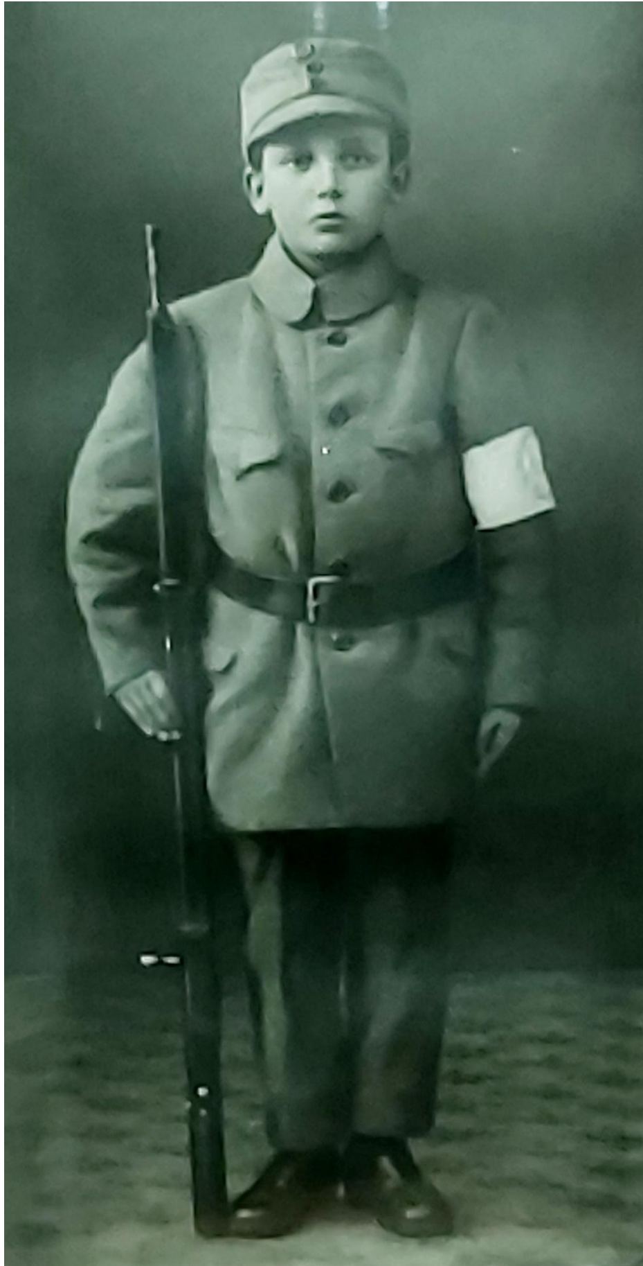
Tätä sotilaspoikaa ei ikä paina. Valitettavasti pojasta ei ole tarkempia tietoja.