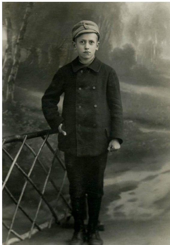
Tuntematon 13 vuotias sotilaspoika 1918.