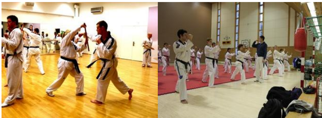
Kuvat: Harrastusvaliokunnan järjestämä Talvisuurleiri Kisakallion Urheiluopistossa.