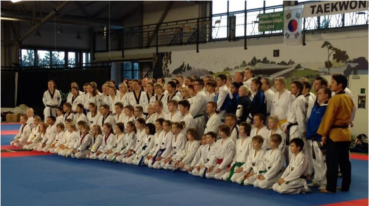
Talvisuurleiri 2014

Suuri osa Suomen Taekwondoliiton harraste- ja terveysliikunnasta tapahtuu jäsenseuroissa niiden itsensä suunnittelemalla tavalla. Harrastusvaliokunta koordinoi liiton alaista harrastus- ja koulutustoimintaa pyrkien tarjoamaan laadukkaita tapahtumia ikään, kokoon tai tasoon katsomatta. Lisäksi harrastusvaliokunta pyrki edistämään lajin julkisuuskuvaa medioissa ja kehittämään liiton tarjoamia seurojen tukipalveluita.