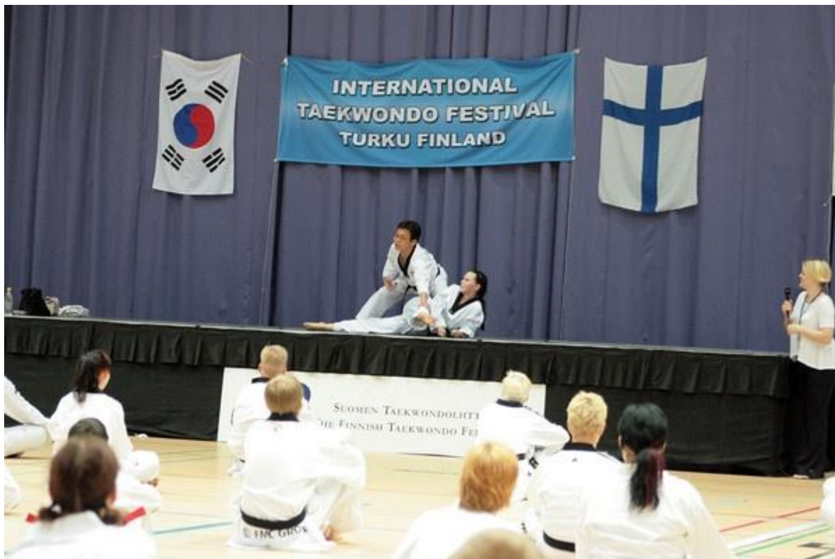
Kansainvälinen taekwondo-festivaali

Suomen Taekwondoliitto jatkaa vuonna 2012 voimakkaassa kehityksessä olevaa kansainvälistä toimintaansa. Liikesarjojen Finnish Open juhlii 10-vuotista taivaltaan ja on kolmatta kertaa Euroopan A-Class -järjestelmän osakilpailu. Kansainvälinen lajin harrastajien Taekwondo Festival -tapahtuma järjestetään vuonna 2012 seitsemättä kertaa.