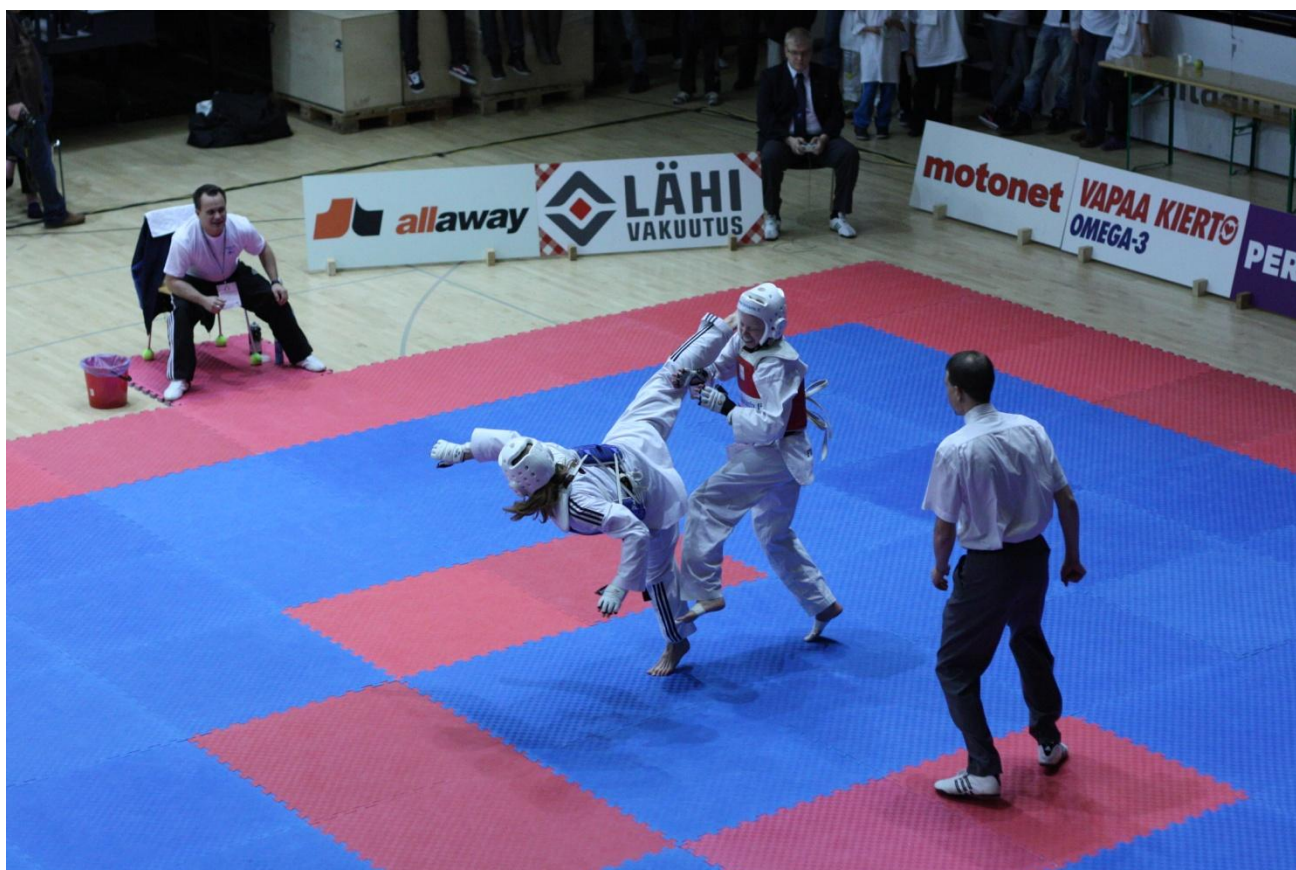
Naisten finaali käynnissä Olympiakamppailutapahtumassa