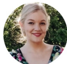
Neea R. lasten ja nuorten harrastevastaava