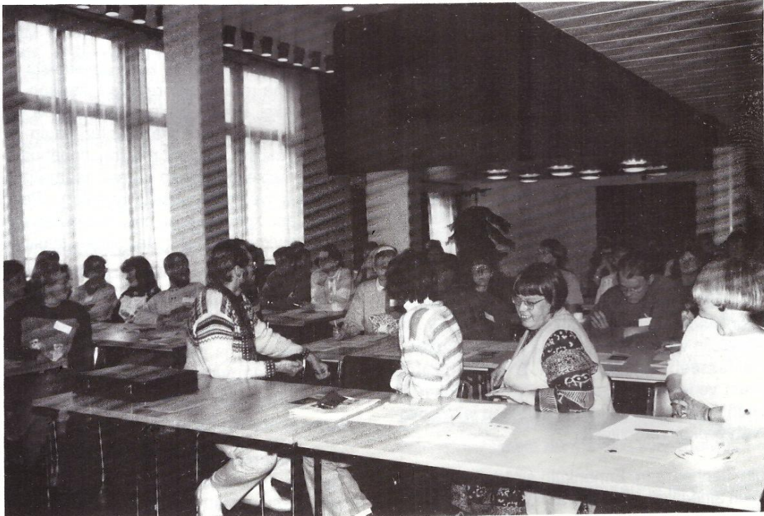
Pienen alkukankeuden jälkeen keskustelu lainehti vilkkaana salin päästä päähän.

- Selvitimme aikoinaan Kennelliiton kanssa myös mahdollisuutta päästä rotua harrastavaksi järjestöksi; sen esteeksi todettiin, että meidän tulisi ensin olla Kennelliiton jäsenjärjestö - ja toistaiseksi olemme halunneet pysyä erillämme. Olemme rekisteröity itsenäinen yhdistys, joka toimii - Kennelliiton ulkopuolella - paimensukuisen lapinkoiran säilyttämiseksi. Kun olemme saaneet virallisen vastauksen esityksiimme, voimme tehdä omat johtopäätöksemme ja ratkaista, mihin suuntaan lähdemme.