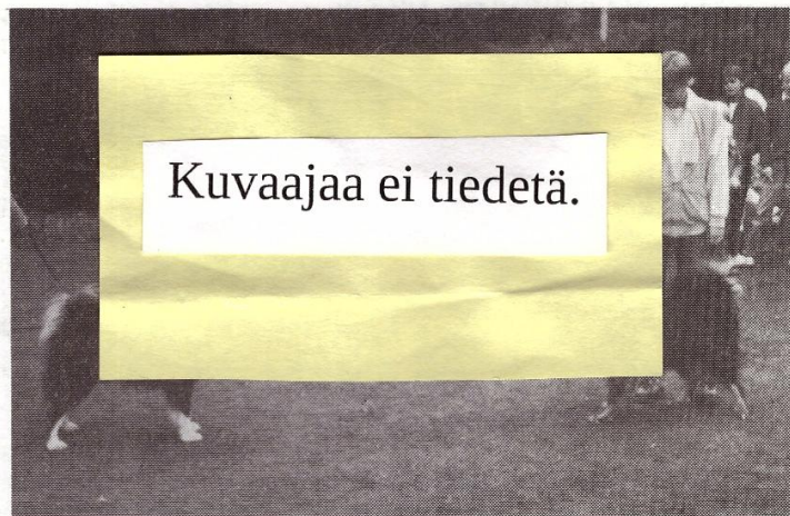
Kumpi meist on mahtavin! Veteraaniurokset Peski Suohkku 18457M/76 ja Peski Naappu 3874A/76. Kuva: Risukarhin kennel.

Siis porokoiramaisuudesta on tullut pelkkä herja ja haukkumanimi kun