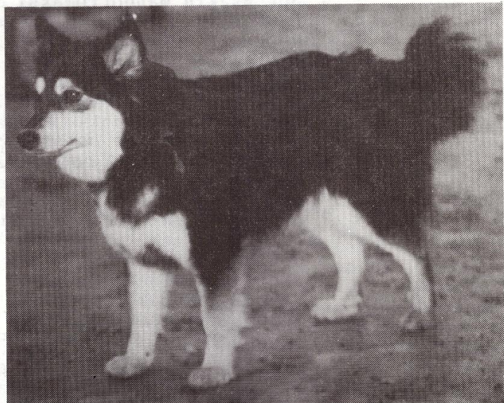
↑ Narttu Hilla, i. Peski Ceepunhutsi, e. Peski Hiutale. (Takajaloissa kaksoiskannukset.)