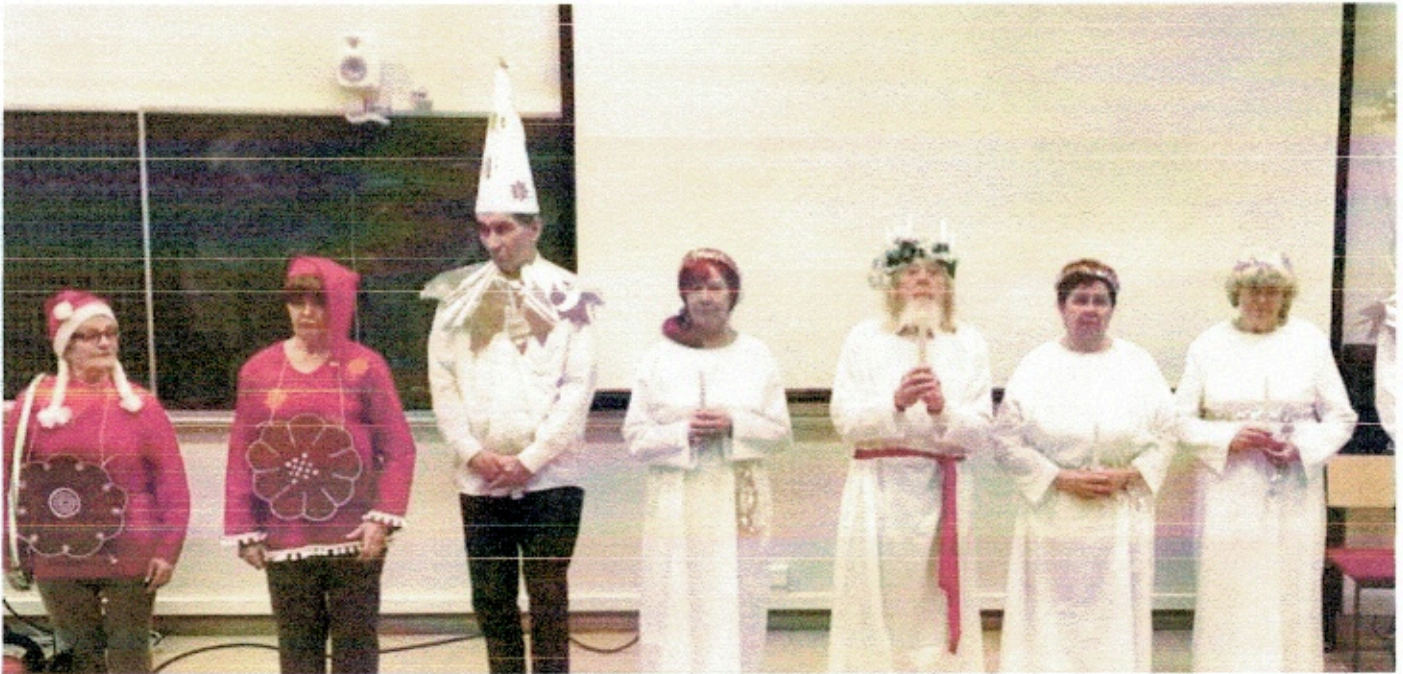
Hulvattomien joulunäytelmä v. 2017

Sittemmin luovuttiin erillisestä pikkujoulusta ja yhdistettiin jäsenten tapaaminen Eräs-teatterin näytökseen, jossa väliajalla nautitut kahvit kokosivat tuttuja yhteen.