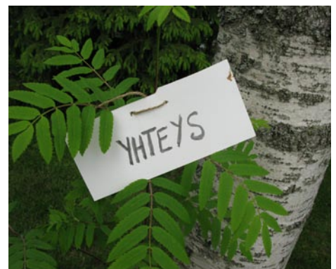
Totuus-teemaan virittäydettiin Mumun kesäleirillä >>> s. 3

Ovatko tunteet totta? Miten ajatuksemme vaikuttavat tunteiden totuuteen? Miten sisäinen turvallisuutemme sävyttää totuuttamme? Miten tämänhetkinen neurotiede valaisee tunteiden totuutta?