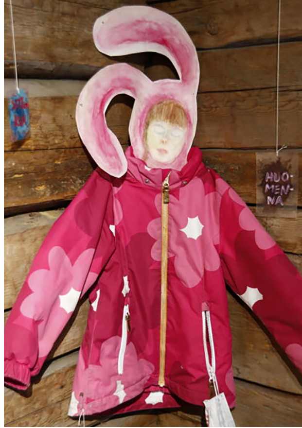
Osa Tiina Jaakkolan installaatiosta nimeltä "Kintsugi – kun jokin särkyi".

Korona-aika on vaikuttanut yhdistyksessä erityisesti kurssitoimintaan. Kurseja on peruuntunut, ja osallistujamäärät toteutuneissakin on pidetty hyvin pieninä kullois-