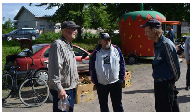
Viime kesänä Luopioisten torilla entisiä yhteiskoululaisia oli koolla ennätysmäärä eli yli kolmekymmentä.

suosittuja, väkeä on ollut liikkeellä edellisvuosia runsaammin.