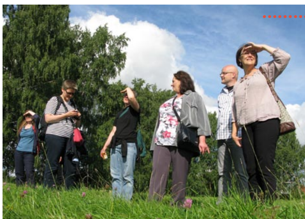
Taivastelua Koroistenniemellä.

Tapaamme tilaisuuden jälkeen Porthanian ala-aulassa vahtimestareiden toimiston edessä ja siirrymme siitä keskustelemaan teemasta.