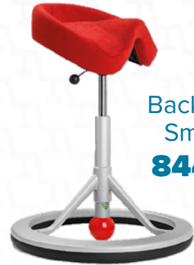
Backapp Smart 844 €