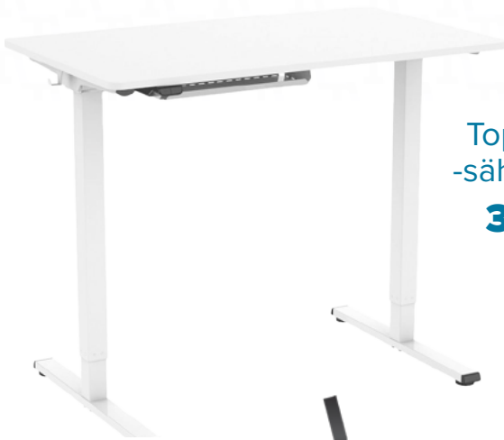
Top Single -sähköpöytä 365 €