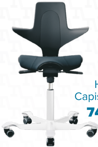
HÅG Capisco Puls 749 €