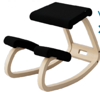
Varier Variable 349 €