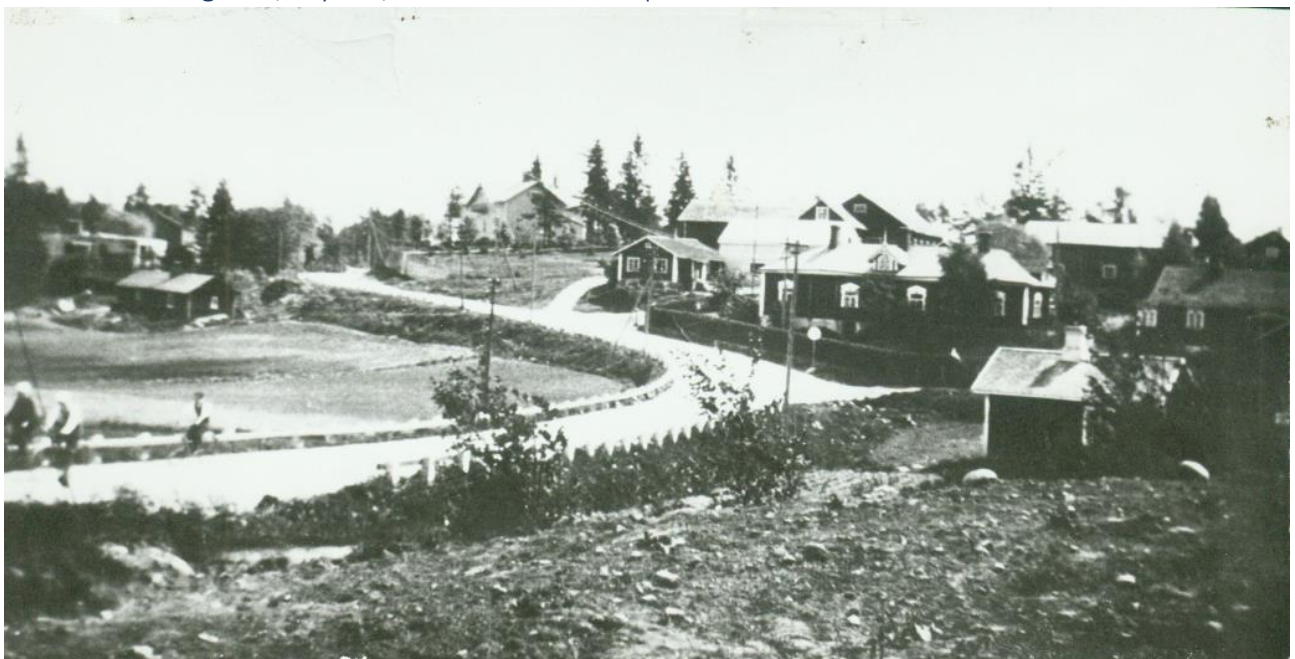
1950-luvun Bergkulla, Skyttas, Bertas. Åbergilta saatu kuva.