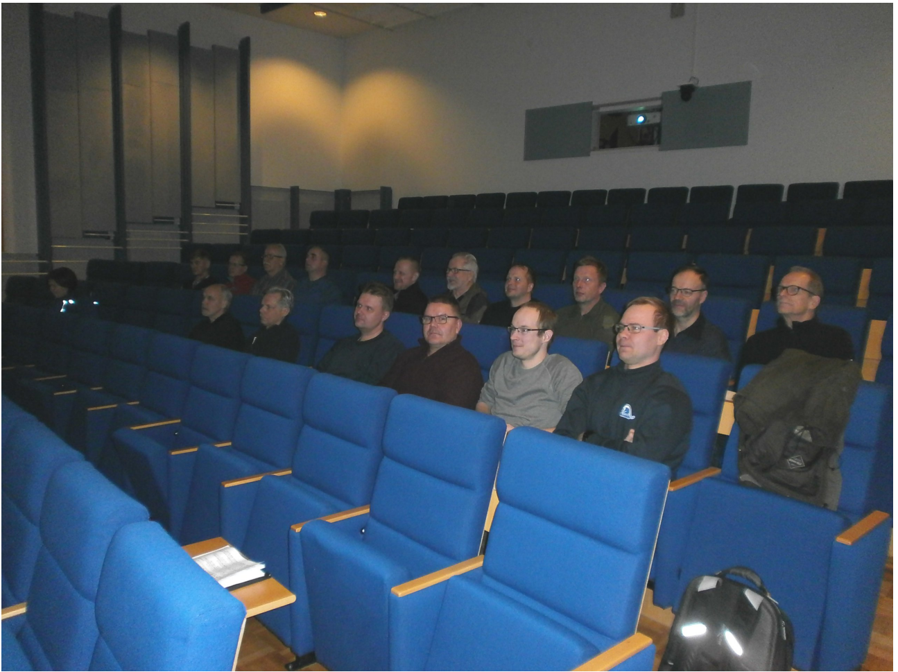
Konnevedellä oli sääntöjä kertaamassa 16 henkeä viidestä Keski-Suomen Hiihdon jäsenseurasta.