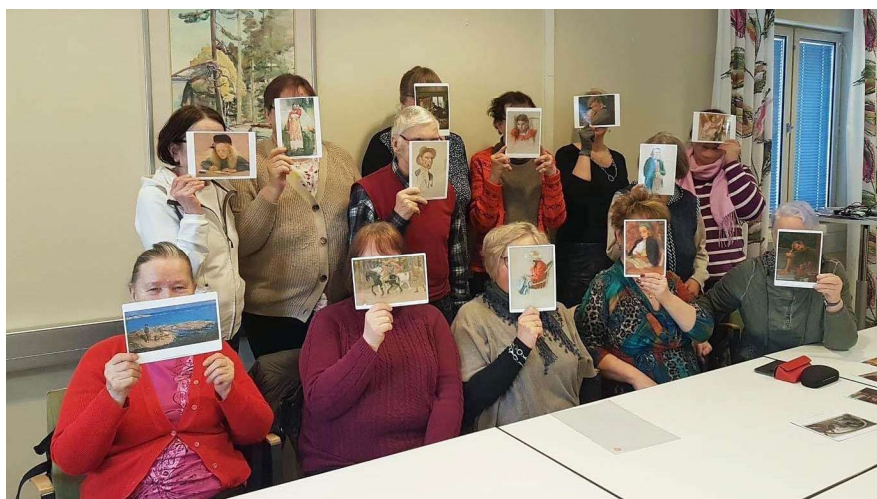
Tutustumisleikki vapaaehtoisten kokoontumisessa.