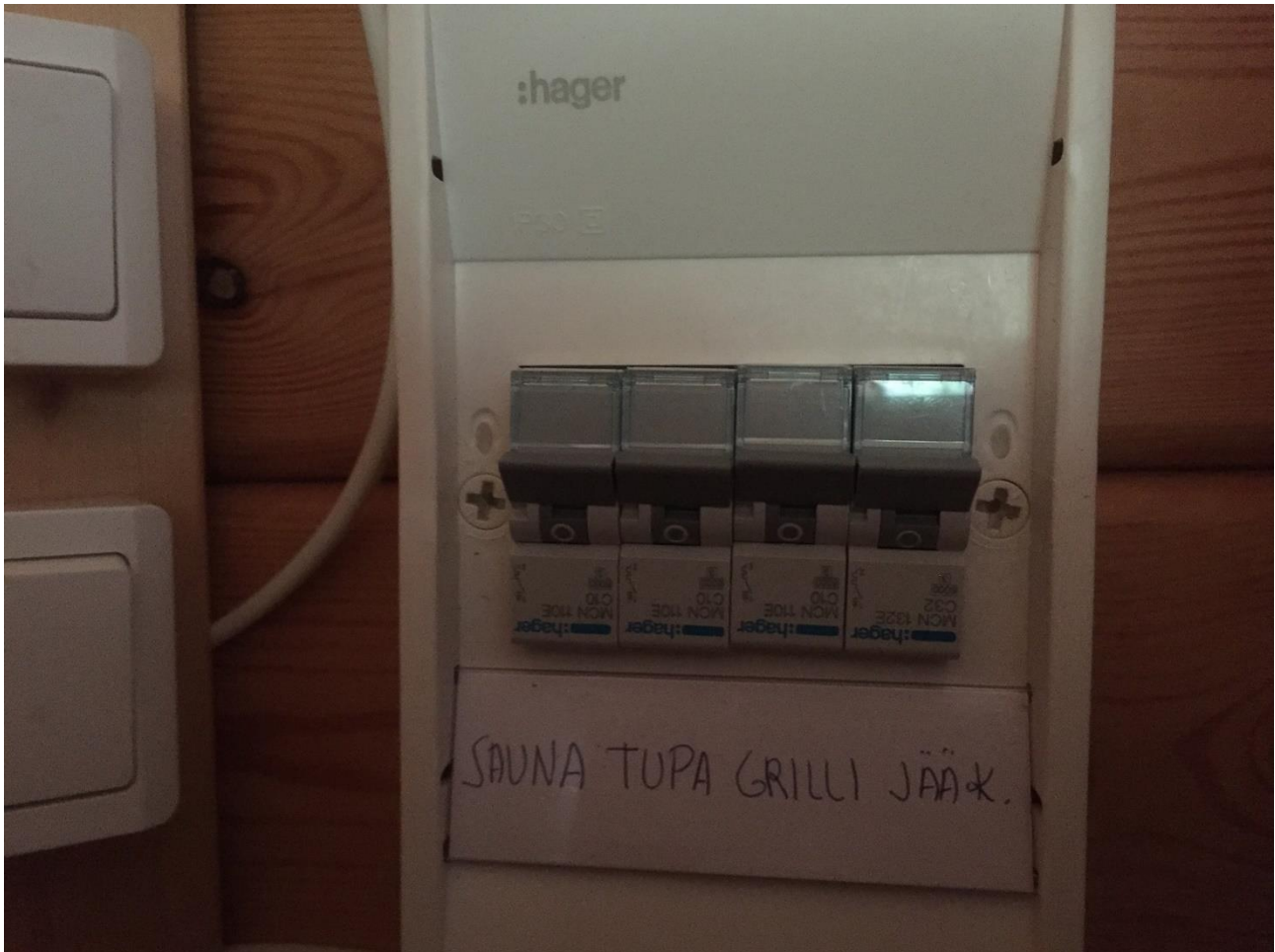
Kuva 2. Pääkytkimet on joka rakennukselle ja jääkaapille erikseen. Poistuessasi jätä kytkimet 0-asentoon.