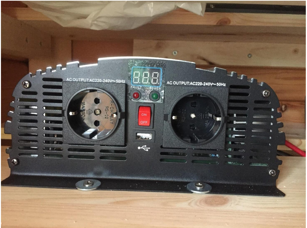
Kuva 3. Invertteri, 1500w siniaalto, kytkeytyy punaisesta kytkimestä.