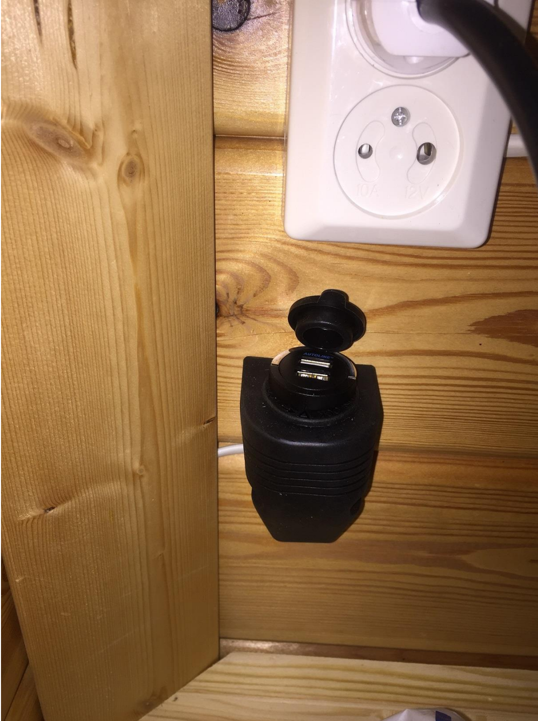
Kuva 4. Sekä tuvassa että grillikatoksessa on 12v tupsyt/usb latauspistoke puhelimia ym. Varten.