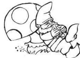
Lopuksi pistettiin jalalla koreasti