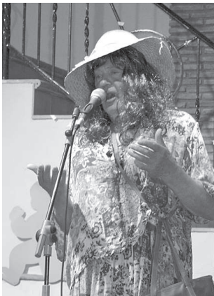
Balladi Unohtumattomasta Elmeristä