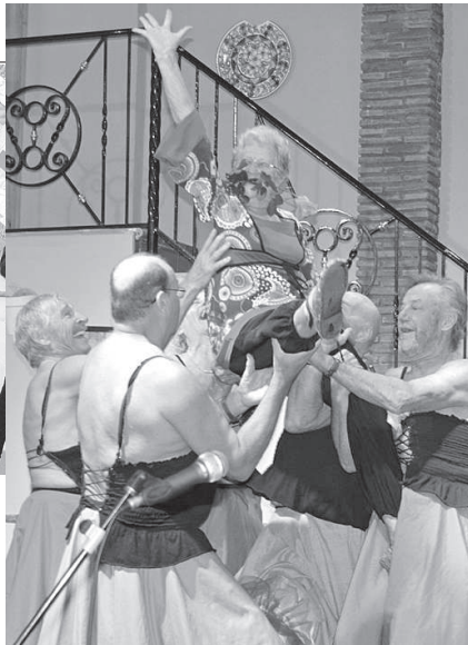
Ohjaaja Raijan ilmaan heitto