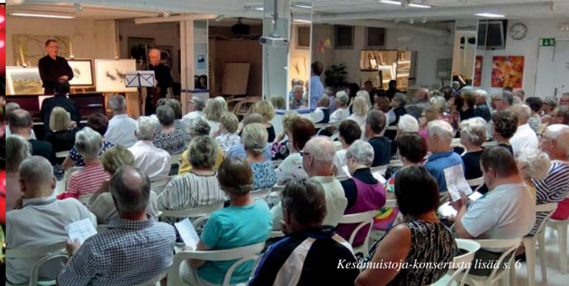
Kesämuistoja-konsertista lisää s. 6

Asociación Finlandesa Suomela • Jäsenlehti n:o 155 • Joulukuun 2016