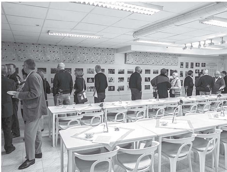
Kameraseuran näyttelyssä oli paljon vieraita tutustumassa kuviin

Kaikki tiedämme, että valokuvauksen harrastaminen on muuttunut todella paljon, kun mukaan on tullut digitaalinen tekniikka ja sen mukaan kuvaamiseen ei edes tarvita perinteistä kameraa, vaan kuvia voi ottaa myös kännyköillä ja tableteilla. Nyt kuvia voi ottaa yhdestä kohteesta kymmeniä ja valita niistä paras. Näin ei ollut ennen. On selvää, että kalliilla järjestelmäkameroilla on mahdollista saada parhaita kuvia, mutta kuka viitsii raahata mukana monen kilon