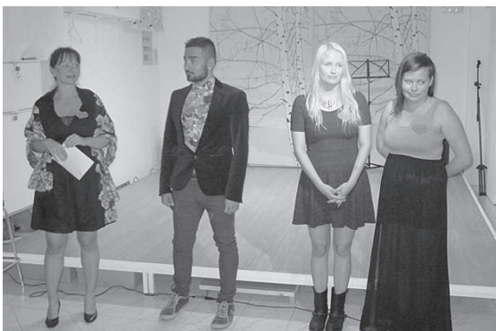
Suomelan harjoittelijat olivat valmistaneet hauskan musiikilla höystetyn dia-esityksen touhuistaan harjoittelunsa aikana.