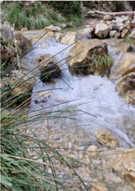
Loppuvuotta kohden vesimäärä ja virtaus lisääntyvät ja antavat enemmän haasteita.

Reitti alkoi vaikeutua. Isojen ja liukkaiden kivenlohkareiden takia piti olla entistä tarkempi mihin astui. Minulla oli päällä vaellushame ja kun humpsahdin vähän syvemmälle, olin vyötäröä myöden märkä. Kastuminen ei kuitenkaan ollut vaarallista, koska vesi ei ollut kovin kylmää, mutta virtaus alkoi olla kovaa. Nilkat olivat kovilla. Monesti mietin, miten tässä käy. Minulla oli sauvat, joilla pystyin pysymään pystyssä ja ottamaan pahimman virtauksen vastaan. Luonnolla on aika kovat voimat.