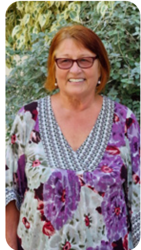
Teksti ja kuvat Riitta Pulkki