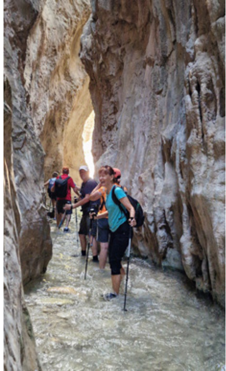
Vesi on kesällä matalimmillaan ja silloin on kiva kulkea vilpoisessa vedessä.