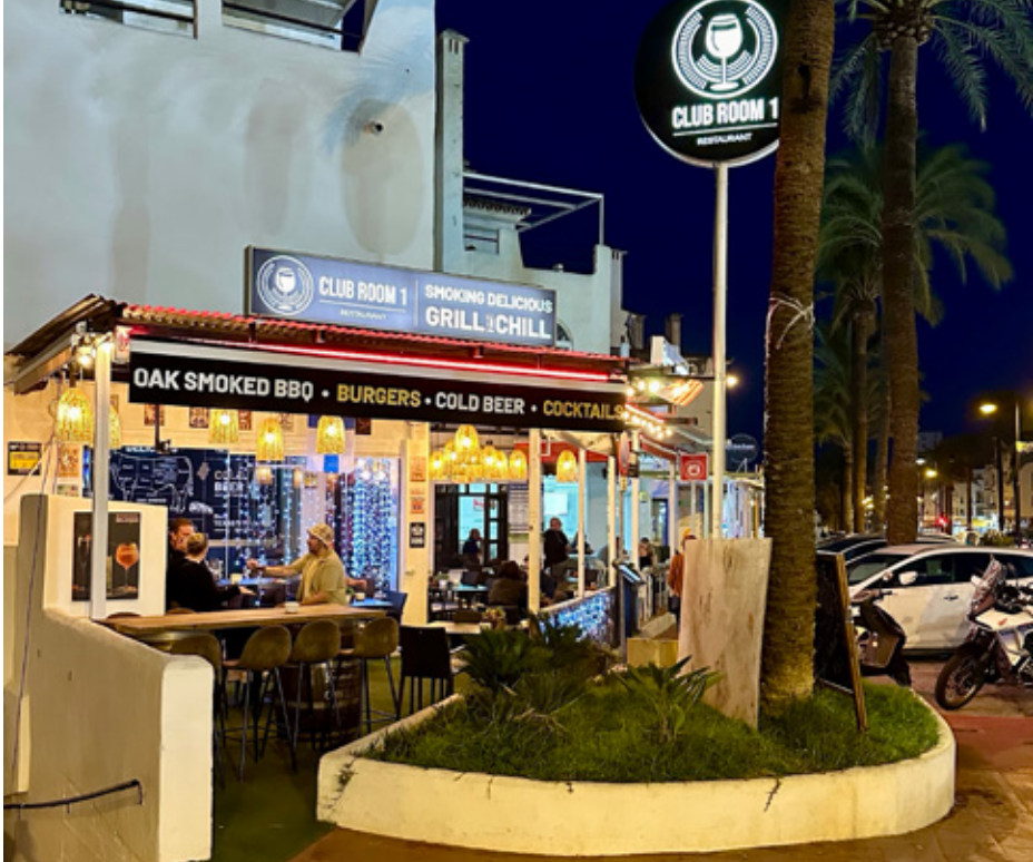
Club Room 1 Ravintola sijaitsee Benalmádenassa osoitteessa Av. Las Palmeras 10