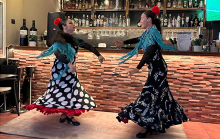
Ravintolassa järjestetään myös paljon ohjelmaa.