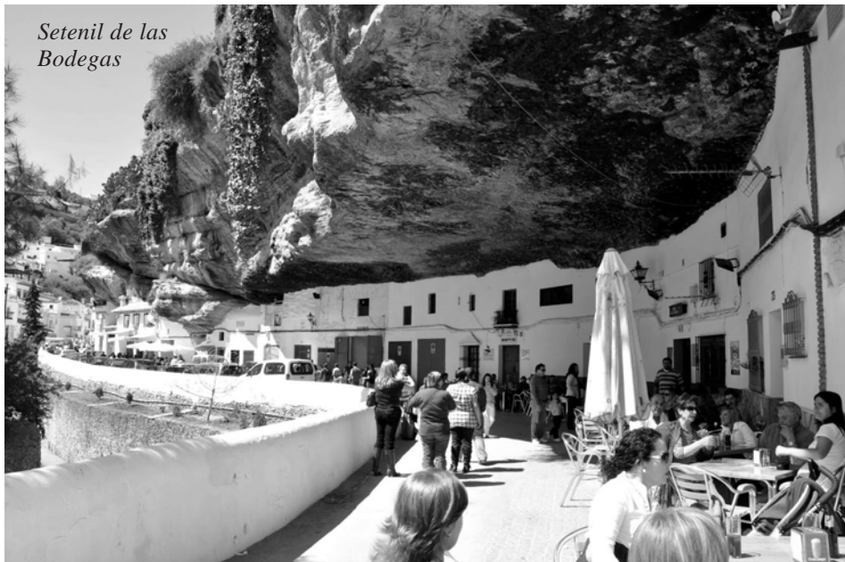
Setenil de las Bodegas