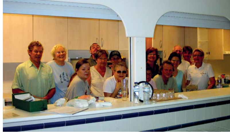
Ahkeria talkoolaisia uusitussa keittiössä syksyllä 2007 jo ennen Suomalan varsinaisen toiminnan alkamista. Etualalla tyylikäs entinen tarjoiluseinä, joka haluttiin säilyttää.

Pääurakoitsijat laajensivat nopeasti suunnitelmien mukaan keittiön johtavaa oviaukkoa ja poistivat väliseinän keittiön ja sen päässä olevan pienen varastohuoneen välistä. Sitten lähes kahteen viikkoon tyhjässä keittiössä, jossa oli vain katto, lattia ja seinät, ei tapahtunutkaan juuri mitään kiirehtimisistä huolimatta, kun sähköurakoitsija vitkasteli. Hän toimi jossakin alansa opettajana ja teki hommia muulla työmailaan. Siitä oli haittaa sikäli, että usia kalusteita pääurakoitsijat eivät päässeet asen-