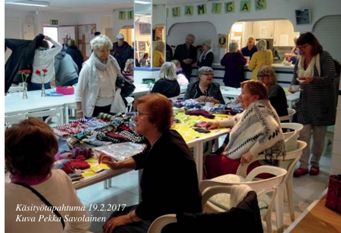
Käsityötapahuuma 19.2.2017

Asociación Finlandesa Suomela • Jäsenlehti n:o 159 • Lokakuu 2017