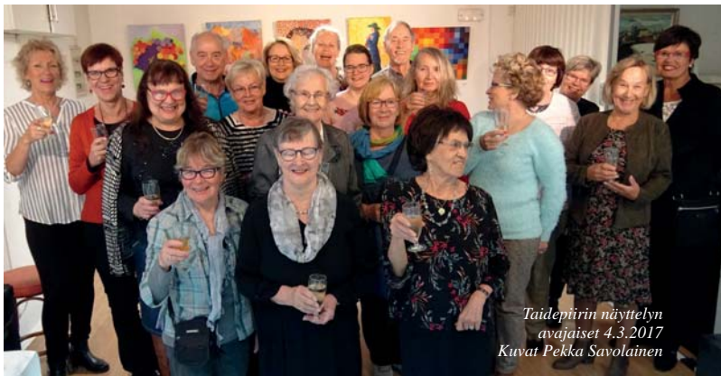
Taidepiirin näyttelyn avajaiset 4.3.2017 Kuvat Pekka Savolainen