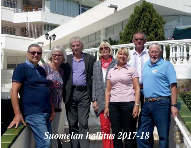
Suomalainen hallitus 2017-18