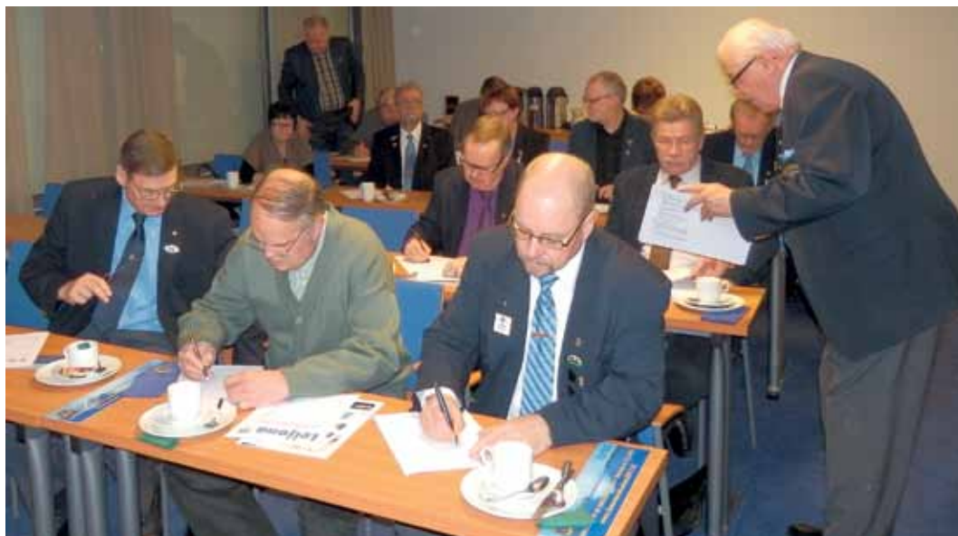
Alefoorumissa ideoitiin jäsenhankintaa ja jaettiin hyväksi havaittuja keinoja uusien jäsenien hankinnassa klubien kesken.

Tilaisuuteen osallistujia viihdytti Mäntyharjun huuliharppitit reipashenkisellä musiikilla ja laululla.