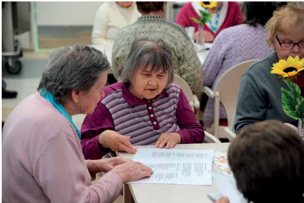
Palvelukeskuksen "tytöt" yhteislaulussa Uralin pihlajaa...

Tilaisuuden päätyttyä asukkaiden siirtyessä omiin tiloihinsa käytäviltä kaikui iloisia kiitoksen sanoja tilaisuudesta sekä tervetuloitotuksia uudemman