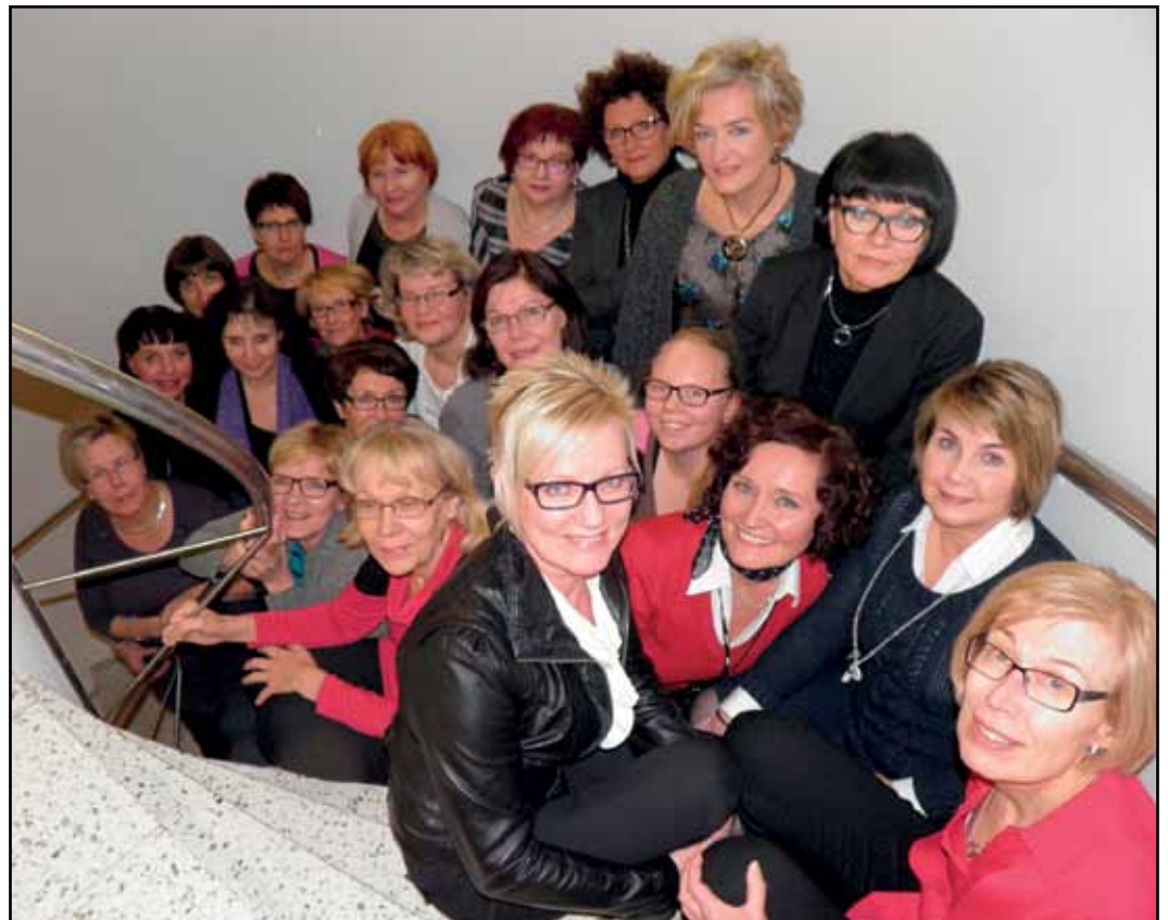
Weerat Pikku-Jouluissa,yhdessä viihtyen, Anitta-Weeran kuvaamana

piä ovat uusien jäsenien vastaanottotapa, jäsenistön sitoutuminen ja tyytyväisyys, yhdessä viihtymisen tavat, jatkuva arvokeskustelu sekä uusiutumisen ja muutostahto.