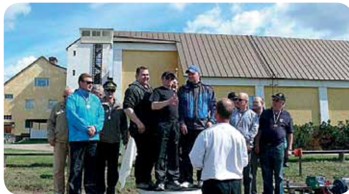
Kilpailujen voittajakolmikko palkintoja vastaanottamassa.