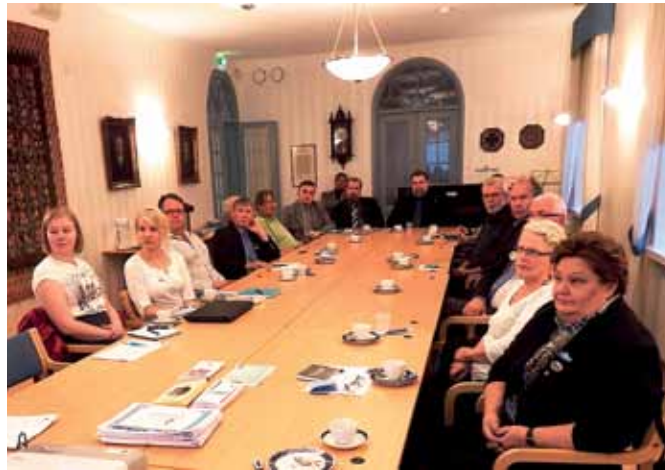
Lohkon klubien avainhenkilöt kokoontuivat yhteiseen tapaamiseen Jyränkölän Syrjälä-saliin.