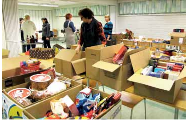
Lahjojen järjestelyä vähävaraisten jakotilaisuuteen.

Kuusankosken Metsänkävijät ry (poikalippukunta) Kuusankosken Partiotytöt ry (tyttölippukunta) Avustuksen määrä 5 000 €.