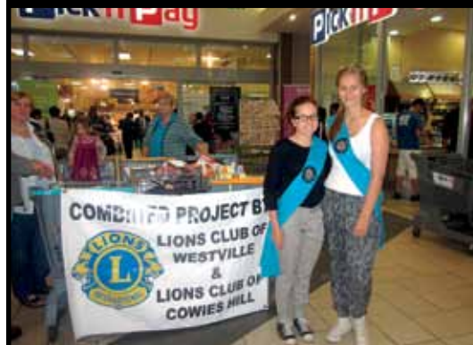
Hyväntekeväisyyttä Durbanissa: lahjoitusten keräämistä paikallisessa ostoskeskuksessa.