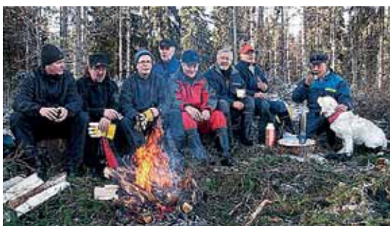
LC Rakuuna on toimittanut palveluna havuja hautojen talvikoristukseen.

LC Rakuuna on lukuisten muiden aktiviteettiensa ohella toimitanut palveluna parina syksynä havuja hautojen talvikoristeluun.