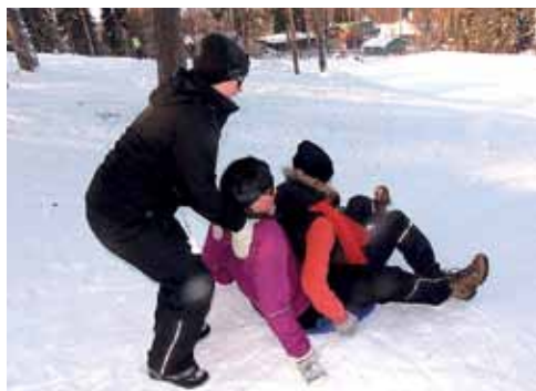
Laskiaisrieha Virojoella Lapinvuorella.