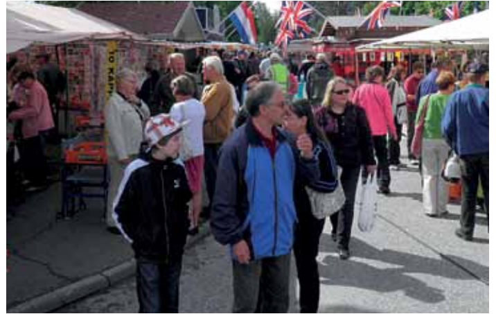
Markkinat ovat LC Mäntyharjun vuosittainen pääaktiviteetti.

Tarjolla on kaikkea perinteistä markkinamyymä: ilmapalloja, vaatteita, makeisia, koristeineitä, erilaista syötävää – siis