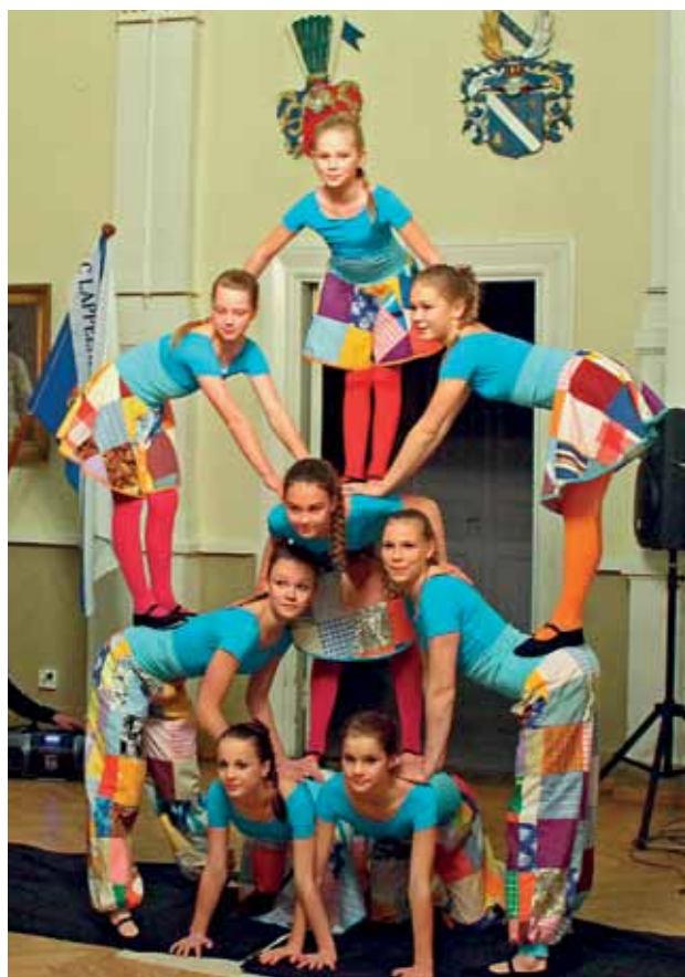
Taidekoulu Estradin ihastuttavat nuoret taitajat esiintyivät 25-vuotisjuhlassa. Kuvassa tyttöjen voimistelu-/akrobaattiryhmä.

Lions Club Lappeenranta / Saimaa Lion Kimmo Ruokoniemi