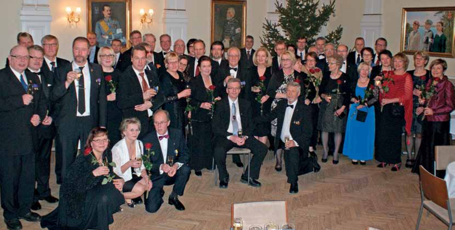
LC Rakuunan 25-vuotisjuhlia vietettiin lähes 50 leijonan ja lady:n voimin.