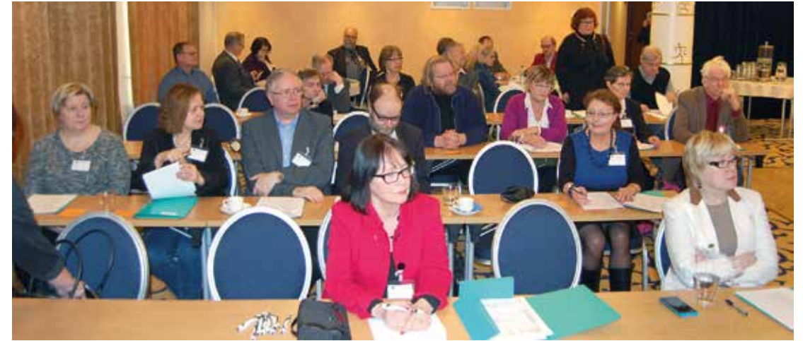
Kokousväkeä Kuopiossa 23.3.2014.