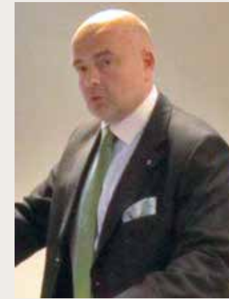
Oikeusministeri Andres Anveltin mielestä on tärkeää, että virolaiset lautamiehet osallistuvat yhteiskunnalliseen keskusteluun.