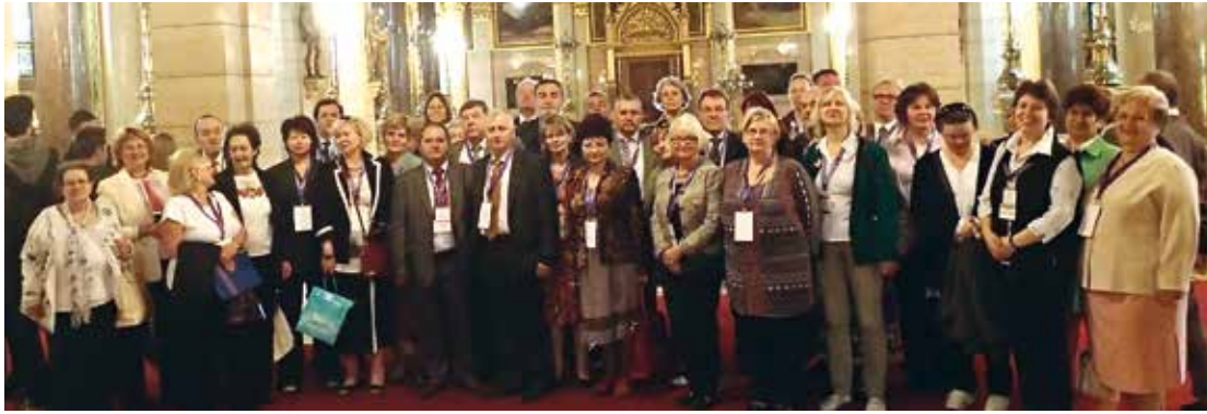
Budapestissa kokoontuivat kaikkiaan 14 maan maallikotuomarijärjestöjen edustajat.