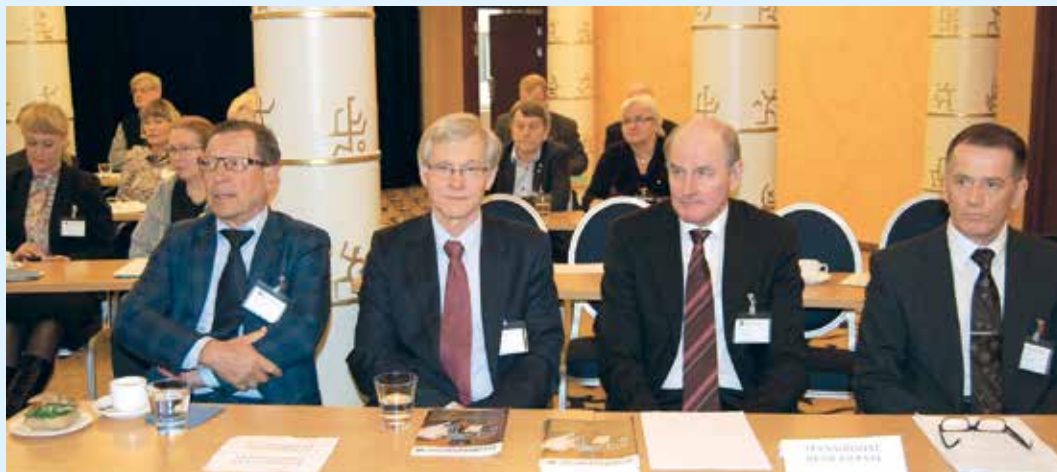
Rivistö arvovaltaisia luennoitsijoita, ajan hermolta.

-Käytössä olevin resurssein tuetaan Viron, Latvian ja Liettuan lautamiesten yhdistystoiminnan järjestäytymistä muun EU:n alueen tasolle, kuvasi Laukkanen joi- takin eurooppalaisen yhteistyön päämääriä.