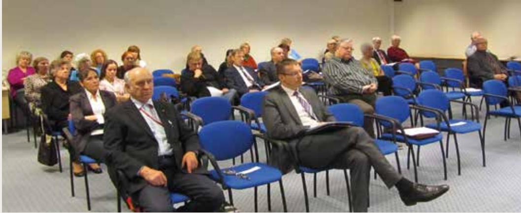
Tallinnassa järjestettiin Viron maallikotuomariyhdistyksen ensimmäinen koulutuspäivä 6.5.2014. Mukana oli suomalaisedustus ja arvovaltaisia luennoitsijoita, muun muassa oikeusministeri.