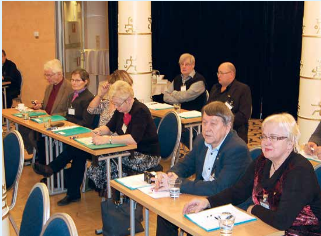
Osallistujia kuuntelemassa luentoja Kymen, Lapin, Oulun ja Länsi-Uusimaan alueilta.