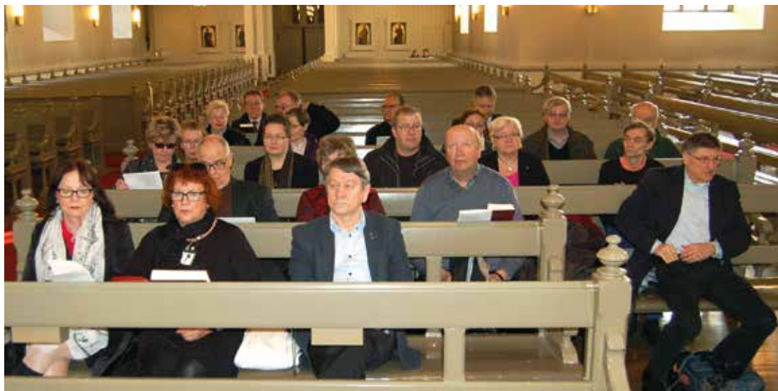
Lautamieskirkko on perinteinen lautamiespäivien yhteyteen kuuluva hartaus- ja hiljentymistuoquio.