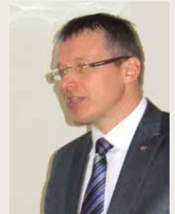
Syyttäviviraston edustaja, pääsyyttäjä Norman Aasa totesi, että lautamiehet ovat oikeudessa tarpeellisia.