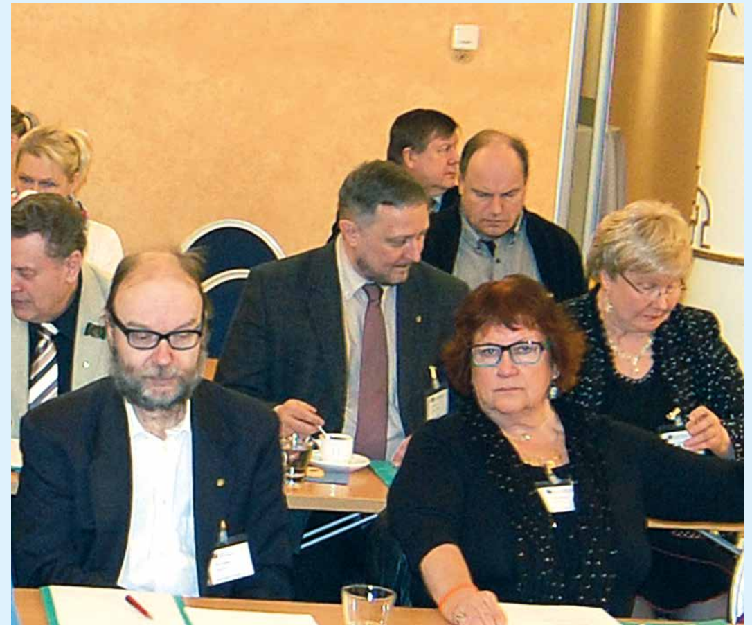
Eteläisen Suomen aktiivisia osallistujia.

Lisäksi laamanni Lindgrenin mukaan tulevaisuudessa (mikä ei ole kaukana) on Suomessa 11 kärjäoikeutta, summaariset asiat on siirretty ulosottoon, muutoksenhakua hovioikeuteen on rajoitettu eikä lautamiehiä enää ole.