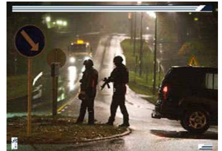
Järjestäytyntä rikollisuus monimuotoistuu, kansainvälistyy ja tunkeutuu yhteiskunnan eri toimijoihin.

Järjestäytyntä rikollisuuden perimmäisenä päämääränä on poliittisen ja taloudellisen vallan saavuttaminen. Esimerkiksi järjestäytyntä rikollisuus, jengit ym. pyrkivät luomaan myönteisiä julkisuuskuvia ja siinä ne hyödyntävät mediaa.