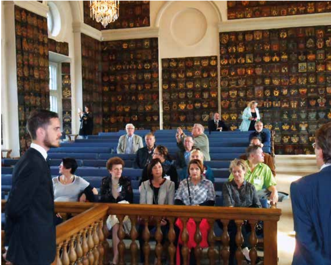
Ritarihuonesalin seinillä ja portaikossa on kreivillisten, vapaaherrallisten ja aatelisten sukujen kuparilevyille maalatut vaakunat. Niitä on yhteensä 2897 kappaletta.