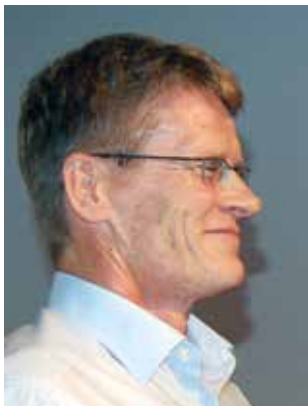
Jarmo Hirvonen valotti oikeuden ja median suhdetta.

-Syyttäjille toimittajat soittelevat paljon vaikka muillekin voisi soittaa. Joskus ei voi olla varma siitä, kumpi toimittajia enemmän kiinnostaa, julkisuuden henkilö vai itse asia. Se, kenestä ja miten media on kiinnostunut riippuu mediasta. Usein kuitenkin media hakee draamaa.