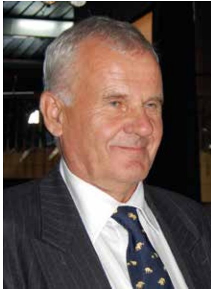
Poliisineuvos Rauno Ranta

(Juttu muokattu Rauno Rannan luentomateriaalista koulutusristeilylle syyskuussa 2013. Keskusrikospoliisin päällikkö, poliisineuvos Ranta jäi eläkkeelle lokakuun alussa 2013)