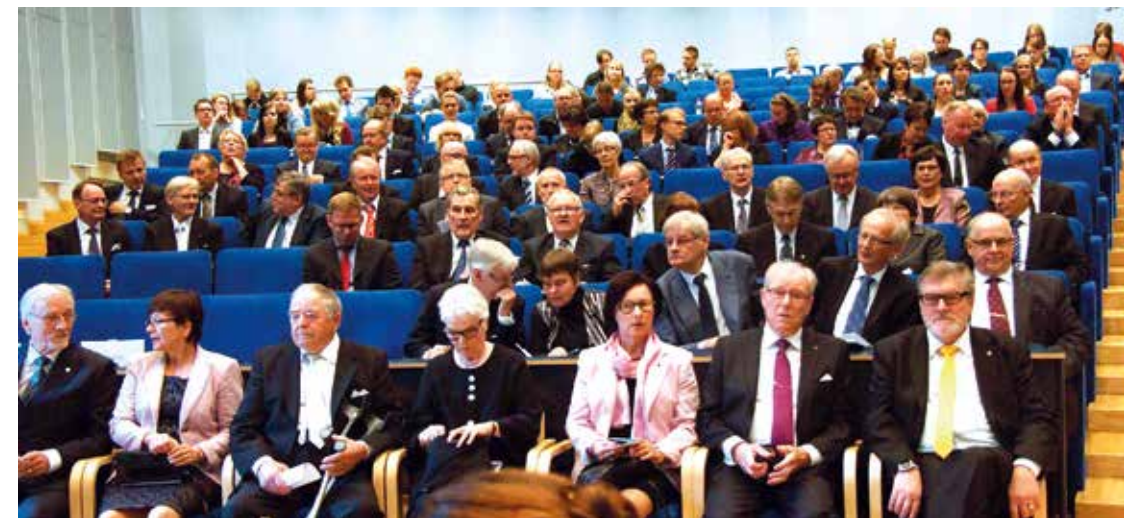
Rovaniemen seminaariyleisöä.