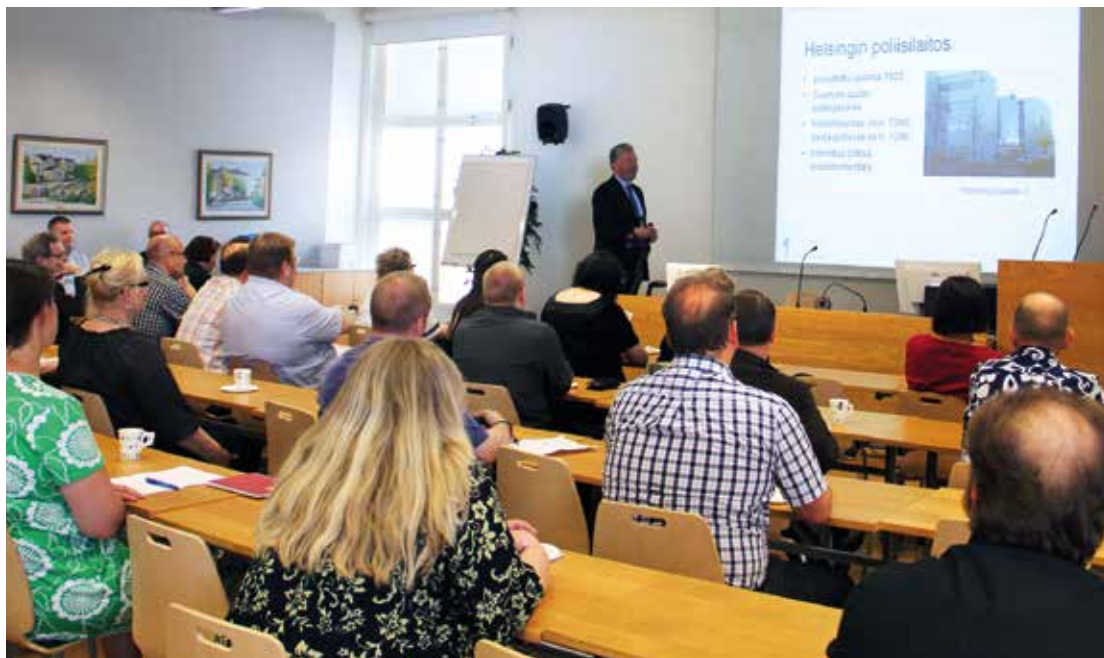
Helsingin poliisin kanssa järjestetyssä koulutustilaisuudessa uusilla ja kokeneemminkin lautamiehillä oli erinomainen tilaisuus kysyä asiantuntijoilta erityisesti esitutkintaan liittyvistä asioista.

Helsingin Käräjäoikeudessa aloitti tämän vuoden alussa 128 uutta lautamiestä. Vaikka Helsingin 300 lautamiehestä 172 on kokeneita, pisimmillään kuudetta kautta työskennelleitä konkareita, aiheutti muutos selkeän koulutustarpeen. Käräjäoikeus järjesti uusilla lautamiehille kolmen tunnin mittaisen perehdyttämiskoulutuksen valitaisuuden yhteydessä maaliskuussa.