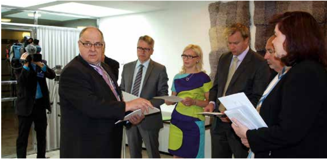
Suomen Maallikkotuomarit ry luovutti kesäkuussa eduskuntaryhmien edustajille vetoomuksen maallikkotuomarijärjestelmän säilyttämisestä ehyenä kokonaisuutena.

Valmisteilla oleva elokuva "Käräjäkiviltä Sisätiloihin" on läpileikkaus suomalaisesta rikosoikeusjärjestelmästä ja maallikkotuomareista eli lautamiehistä sen osana. Kuvausista merkittävä osa on jo tehty, muun muassa oikeus-toimijoita on kuvattu, samoin taltioitu koulutusristeilyn tapahtumia.