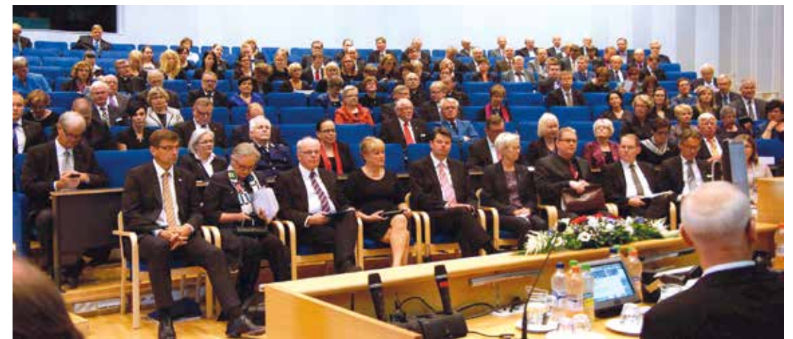
Juhlaseminaari kokosi runsaasti osallistujia

Seminaarissa puhunut korkeimman oikeuden presidentti Pauliine Koskelo muistutti, että oikeusjärjestys on tänään aivan toisenlainen kuin vielä neljännesvuosisata sitten, eikä ero rajoitu normitason muutoksiin, vaan kyseessä on suuri systeeminen murros, joka liittyy erityisesti oikeuden eurooppalaistumiseen ja sen myötä tapahtuneisiin valtiosääntöisiin muutoksiin.